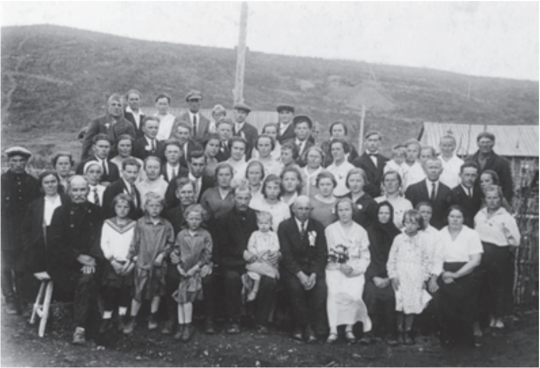
■ Kuva 4. Inkerinsuomalaiset häät kultakaivosalueella Siperiassa vuonna 1936.

uskonnollisia kuvia 153 sekä kielsivät uskonnolliset kokoontumiset: ”Usein tuntuu niin raskaalta, kun ajattelee ettei täällä enää saa kokoontua Jumalan palveluksiin, mutta onhan täällä vielä niitakin, jotka kertovat ijankaikkisen sielun asioita.” 154 Kristillisiä kokoontumisia vaikeutti myös suomalaisten hajottaminen uskonnottomien ja muiden uskonnollisten ryhmien keskelle. Monissa kirjeissä kuvataankin uskonnollista diasporaa eikä niinkään etnistä diasporaa muista inkerinsuomalaisista. Uskonnosta tuli vähitellen perhekeskeistä tai pienen inkerinsuomalaisen piirin ilmiö.