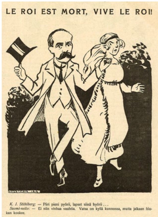
■ Kuva 2. Ståhlbergin politiikkaa kommentoitiin aikanaan pilapiirroksissa. Pilalehti Tuulispää ikuisti presidentin kanteensa vuonna 1919.

tavalla ”maan isän” mainetta kuin Tšhekkoslovaakiassa Masarykille.