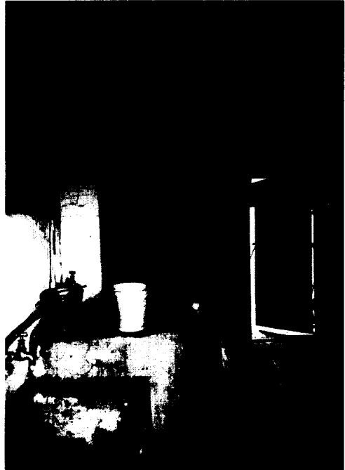
Näyttelyn irtolaisnaisista ei ole jäänyt muotokuvia. Kuva on saunasta, jossa prostituoitu Hämysillä tiedetään harjoittaneen ammattiaan.