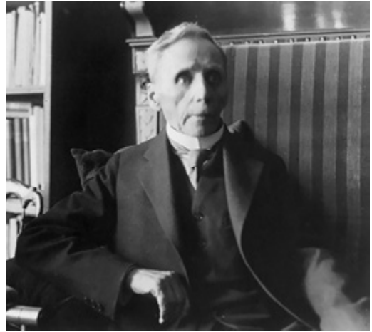
■ Kuva 2. Valtioneuvos J. R. Danielson-Kalmari (1853–1933) elämänsä loppuvuosina.

SDP:ssa oli kokemusta siitä, että rikoslainsäädäntöä oli käytetty sitä vastaan välittömästi sisällissodan jälkeen. 70 Oikeuslaitos ja Etsivä Keskupoliisi (EK) pitivät ääri vasemmistolaisuutta sinänsä rikollisena. 71 Tämä kohdisti painetta myös SDP:hen. EK:n päällikkö Esko Rieki ei erityisemmin pitänyt sosiaalidemokratiasta, mikä kävi ilmi hänen kirjoittaessaan 20.7.1927 SDP:n vähemmistöhallituksesta lähettiläs Harri Holmalle. Riekin mukaan Suomen Sosialidemokraatti oli ottanut myönteisen kannan Itävallan veljespuolueen mellakointiin, mikä oli ”varoittavaksi esimerkiksi meilläkin”. Sympatiansa Rieki esitti avoimesti: ”Voi niitä, jotka porvareista eivät ole arvanneet tai tohtineet muistaa sitä, että sosialis-