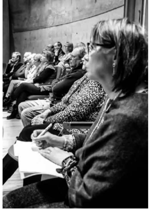
■ Seminaarin yleisöä.

Keskustelua käytiin muun muassa lähteistä sekä niitä tuottaneiden toimijoiden merkittävyydestä. Esimerkiksi Turussa on meneillään uusi historiahanke ajanjaksolla 1971–2010, ja tuolla aikavälillä kaupungissa on toiminut 3 800 yhdistystä. Paikallishistorian tarkoituksena ei ole kirjoittaa historiaa yhdistysten kautta, joten niiden