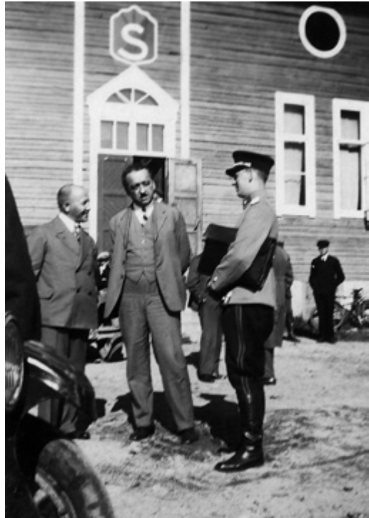
■ Kuva 1. SDP:n (aiemmin Kokoomuksen) kansanedustaja, tohtori Mikko Erich (1888–1948) Mäntsälän suojeluskuntatalolla vuonna 1931. Kuva: Kansan Arkisto, KansA118b-1947.

Vapaussodan voiton kertomus sisälsi laajan viholliskuvan sosialismista, jota oikeistoradikaalit hyödynsivät yrityksissään reformoida valkoisen Suomen yhteiskuntajärjestystä. Viholliskuvan keskittämisessä kommunismiin oli strateginen ulottuvuus, jolla haluttiin lujittaa oikeistovoi- mien yhtenäisyyttä. Eräässä Lapuan liikkeen taustamuistiossa argumentoitiin suoraan, ettei taistelua ”sosialismia” vastaan pitänyt ”missään tapauksessa julkisesti esittää liikkeen tarkoituk-