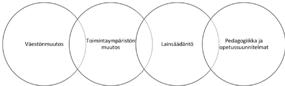
Kuvio 2. Yhteenveto palveluverkkomuutosten kansallisen tason syistä.

koselvityksissä. Opetusta ja kasvatusta pyritään järjestämään nykyaikaista pedagogiikkaa ja opetussuunnitelmaa vastaavissa toimitiloissa. Oppilasmäärät kytkettiin myös pedagogiseen näkökulmaan. Tavoitteena mainitaan myös laadukas ja yhdenvertainen sisältö opetuksessa ja kasvatuksessa. Uudisrakennuksissa päivitettyjä opetussuunnitelmia ja pedagogisia tavoitteita kyetään suunnitelmien mukaan edistämään paremmin. Oppimisympäristössä tavoitellaan pedagogista ja toiminnallista joustavuutta, esimerkiksi esi- ja alkuopetuksessa. Palveluverkkoselvityksillä pyritään vastaamaan tulevaisuuden oppimistarpeisiin ja kehittämään oppimisympäristöjä.