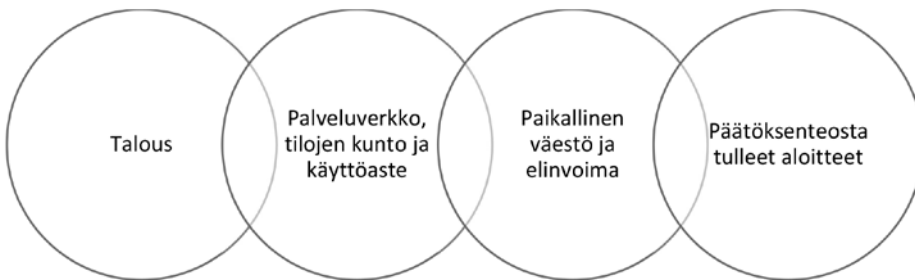
Kuvio 1. Yhteenveto palveluverkkoselvitysten paikallisista syistä.

kytkettyä strategiaan. Joissakin kunnissa on tehty vähenevää oppilasmäärää koskevia periaatteita, jotka liittyvät palveluverkkoon tai opetuksen järjestämiseen. Taustalla voi olla kunnanhallituksen tai lautakunnan päätös palveluverkkotarkastelun tarpeesta tai jokin muu aiempi päätös, jossa on määritelty tarve tarkastella palveluverkkoa tietyssä tilanteessa (esimerkiksi oppilasmäärän väheneminen tietyn rajan alle). Syynä on mainittu myös kunnanvaltuuston tekemä päätös toimialan palveluverkon käyttötalouden määrärahoista. Palveluverkkoselvitys voi käynnistyä lisäksi jatkona aiempaan palveluverkkoselvitykseen tai aiemman suunnittelujakson päätyttyä.