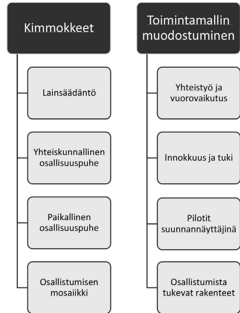
Kuvio 2. Aineistossa esiin nousee osallistumisen kimmokkeet sekä toimintamallin muodostamiseen vaikuttaneet tekijät