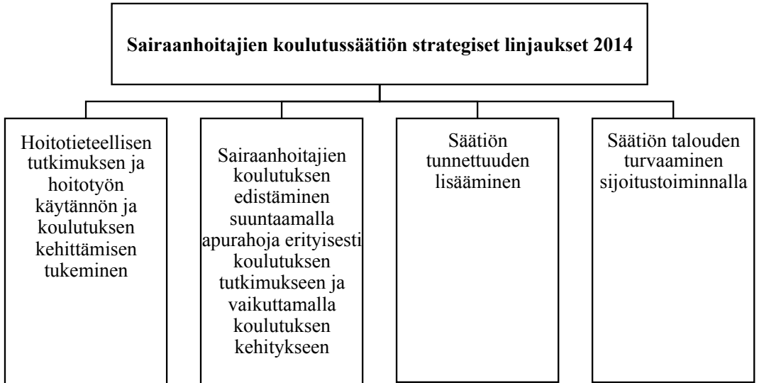
Kuvio 1. Sairaanhoitajien koulutussäätiön strategiset linjaukset 2014