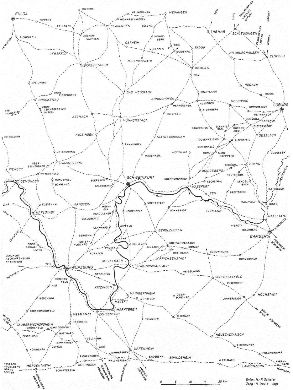
Vägnätet i Mainfranken omkring 1600.