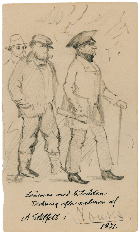
"Länsmän med biträden", skiss av Albert Edelfelt 1871.