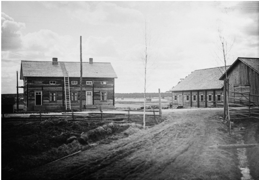
Byggnader tillhörande Yli-Karhu gård i Haapakoski by. Fotografiet är taget senast i början av 1930-talet. Publicerad i boken Suomen maatilat. Tietokirja maamme keskikokoisista ja suurista mautiloista. V osa. Oulun ja Vaasan läänit (1933).