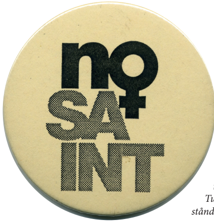
Fredsörelsens pins från 1990-talet som uttrycker ett ställningstagande mot kvinnors frivilliga militärtjänstgöring.

het, och minoritetens starka åsikt att säkerhetspolitik borde bedrivas genom diplomati, fredsarbete och civil krisberedskap hellre än med militära medel. 52