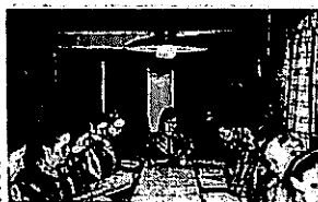
111 PÄIKYLÄMPPI KOKKEIKKON KOKKELAVAN KOKKEIKKON