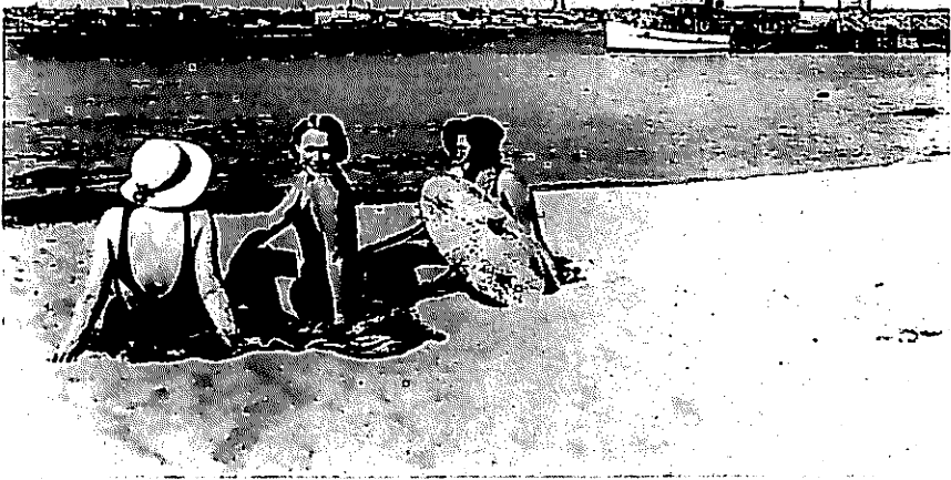
Solbadande skönheter på Rönnskär 1934. På 1920-talet tog solbadandet, havsbaden och sandstränderna, särskilt på Rönnskär och Sandudd, delvis över från siminrättningarna. De båda senare hade plager utan bassäng. HSS flyttade 1934 från Ursins till Ugnsolmen där det fanns havsbad, bassäng och plage.

såsom t.ex. Ponnistus och Jyry i Helsingfors, till en del på att tävlings-simningen var bunden till siminrättningar. T.ex. Jyry ordnade sina första medlemstävlingar 1908, men använde sig av Ursins. En egen simsektion grundade föreningen sålunda först i juli 1917. 55