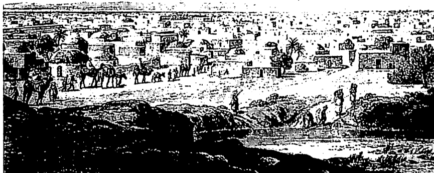
Vy över staden Kano. Barth uppskattade att Kanos befolkning uppgick till c:a 30 000 personer, men antog att antalet fördubblades under torrperioden (januari–april) då handeln var som intensivast. (H. Barth, Reisen und Entdeckung in Nord- und Central-Afrika .)

let. 24 Det är en beskrivning av fattigdomen och dess attribut: varför en fattig man var utstött och föraktad samt varför den rike mannen var omtyckt. Sången är ett bra komplement till de socio-ekonomiska undersökningar om förhållandena på landsbygden i Hausaland (av t.ex. Watts och Hill); sången påtalar hausa-mentaliteten ("Hausa-befolkningens sed är att se ned på den fattige och prisa den rike"), men inte fattigdomens orsaker annat än indirekt, den fattige är lika utstött av samhället som t.ex. en spätelsk.