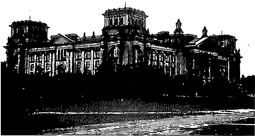
Den förstenade symbolen för den tyska nationalstaten och dess folkrepresentation före återföreningen 1990. Riksdagshuset som hade skadats vid branden 1933 och av artillerield 1945, restaurerades under 1960-talet av Förbundsstaten som "en sinnebild för enheten". En enhet som knappast någon mera ansåg att skulle förverkligas.

tens grundande. Samma attityd – skapandet av ett nytt medvetande med semiotiska medel – framkom t.ex. i namnskicket på gator och städer. Lenin-, Karl Marx- och Thälmann-gator fanns också i de minsta byar, Chemnitz döptes om till Karl-Marx-Stadt, i huvudstaden fanns en Stalinallee och i närheten av Oder reste sig en socialistisk modellstad StalinStadt (sammanslogs 1961 med den nya Eisenhüttenstadt).