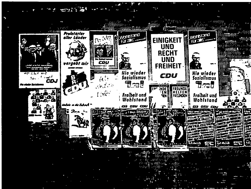
Valaffischer från DDR:s första (och sista) fria val våren 1990. I valen segrade det av kristdemokraterna ledda "Allianz für Deutschland" med slagordet "Aldrig mera socialism", utan "Frihet och välbstånd".

Förbundskansler Helmut Kohl och en del andra politiker (såsom tidigare Willy Brandt) har, ifall de använde termen nation, alltid försökt ge den ett positivt innehåll. Som en följd av de orsaker som berörts ovan framstod den emellertid för de flesta journalister och för många historiker som uppträdde i offentligheten som en negativ fantom.