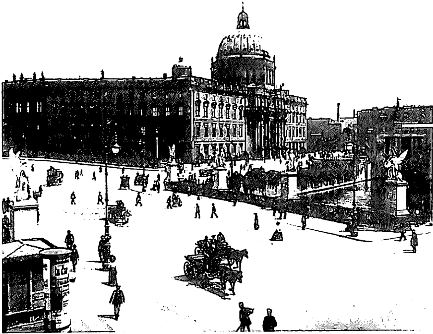
Det kungliga slottet i Berlin från början av 1700-talet, slottsbron med statyerna är från början av följande århundrade. Till höger på bilden en del av det monument som i slutet av 1800-talet restes till Vilhelm I:s ära. Fotografiet är från år 1903.

republikens anspråkslösa regeringsstad har också betecknats som en metafor för den civila demokratin. 3