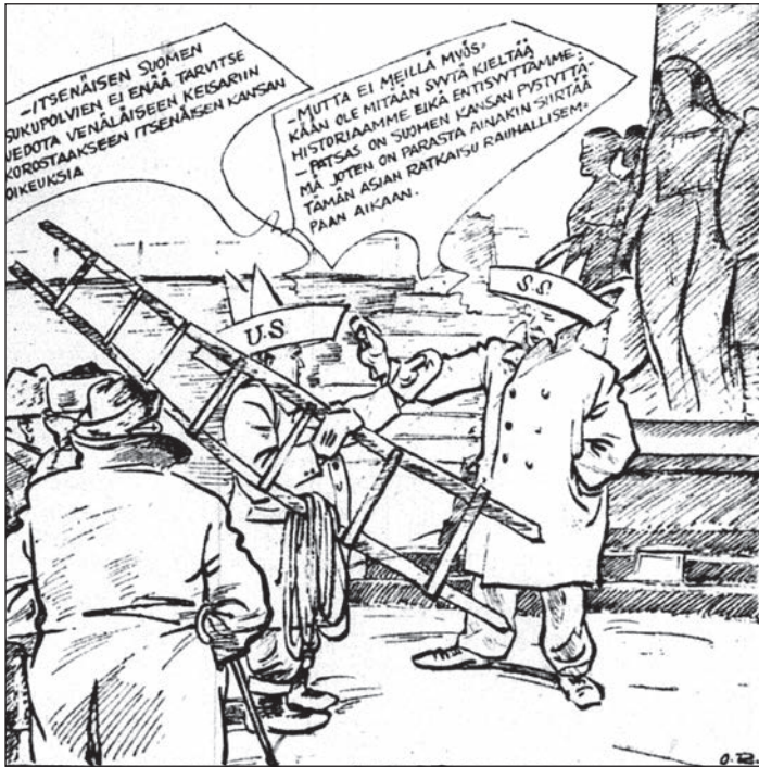
Bild 22. Skämtteckning i Helsingin Sanomat 27.1.1942.

Den [Alexander II:s monument] restes inte som någon sinnebild över den ryska makten gentemot Finland – så som fallet var med den staty över Peter den store, vilken på sin tid fanns i Viborg – och bakom dess tillkomst låg ej heller något underdånigt kryperi för regenten. Det var tvärtom folkets fosterlandskärlek, som tog sig i uttryck på detta sätt – alltså en känsla och styrkekälla som betytt så mycket i Finlands historia, icke minst nu. 190