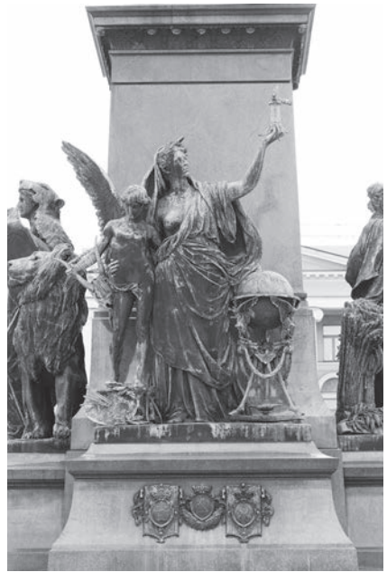
Bild 7. Vetenskapen och Konsten (Lux).

lyra och står på en målarpalett (Bild 7). Freden , skulpturen som vetter mot kyrkan, är också avbildad som en kvinnogestalt klädd all'antica . I hennes högra, utsträckta hand ses en palmkvist och vid fötterna två fredsduvor (Bild 8). Arbetet vetter mot universitetet, och föreställer två människofigurer i arbetarkläder. I sin högra hand håller mannen en yxa och hans vänstra arm och hand vilar på kvinnans skuldror. Kvinnan har en skära i sin högra hand och håller en kärve under den vänstra armen (Bild 9).