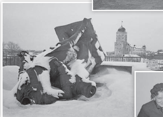
Bild 18. Den störtade statyn av Peter den store i vinterlandskap, i bakgrunden Viborgs slott.