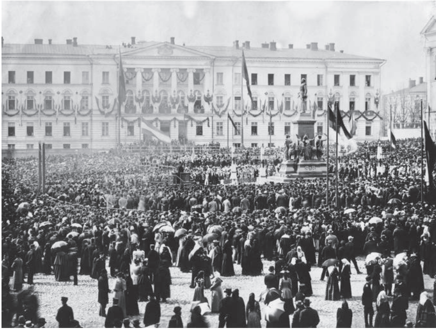
Bild 3. Invigningen av Alexander II:s monument 29.4.1894.

Mätte dessa känslor förblifva beståndade och måtte de för evärdeliga tider tjäna såsom underpant för folkets undersåtliga tillgifvenhet och kärlek för sina Monarker.