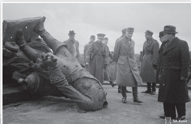
Bild 17. Den störtade statyn över Peter den store, fotograferad 1941. Personerna på bilden är bl.a.: statsminister Rangell, president Ryti, försvarsminister Walden och general Airo. Bakom Walden står marskalk Mannerheim.