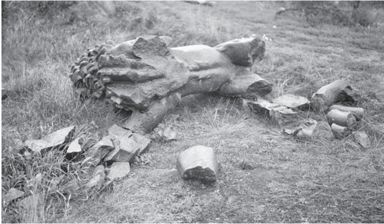
Bild 15. Det störtade och sönderslagna lejonet från självständighetsmonumentet i Viborg.