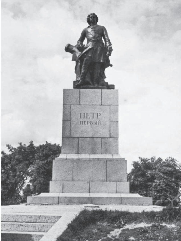
Bild 20. År 1954 återupprestes Peter den stores monument för tredje gången.

sköld. 125 Ett fragment av piedestalens inskription förvaras i museet på Viborgs slott.