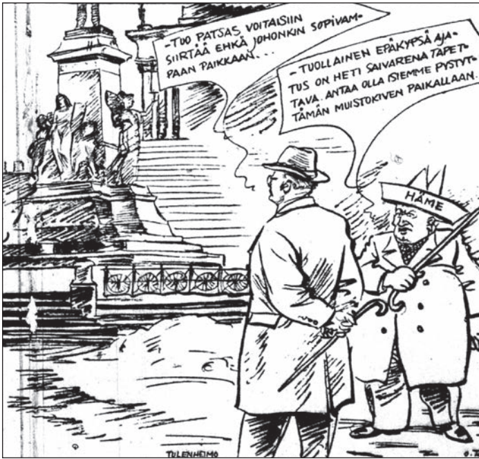
Bild 21. Skämtteckning i Helsingin Sanomat 5.5.1940.