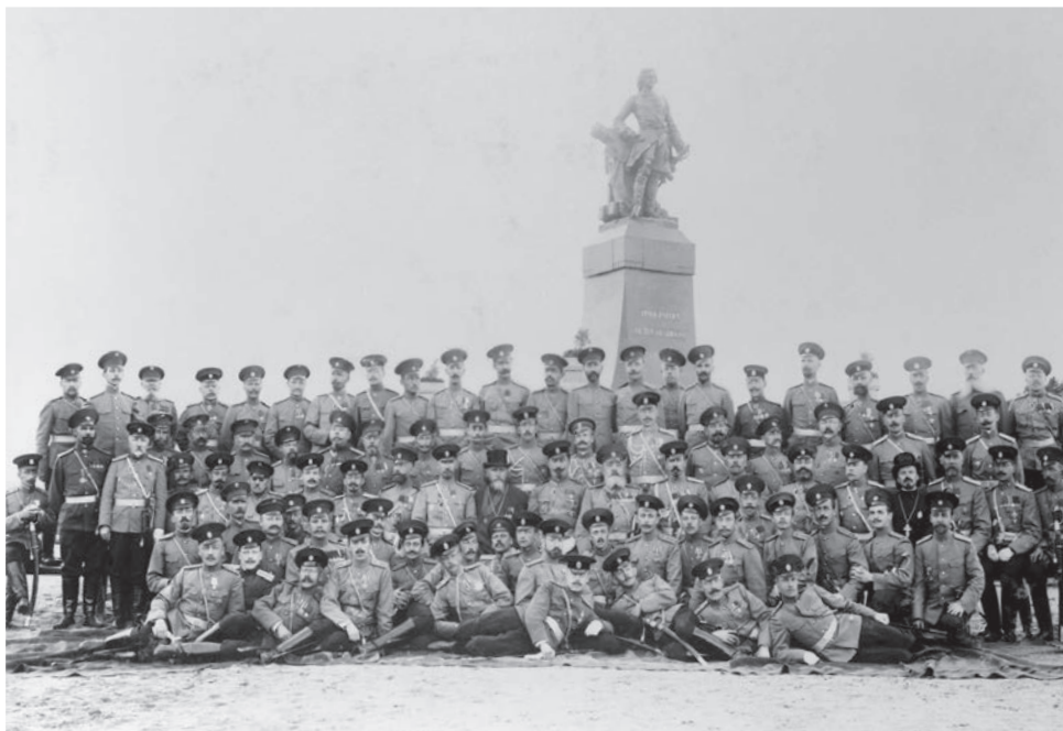
Bild 12. Invigningen av monumentet över Peter den store 1910.

borna antagligen helt självmant skulle undvika all form av festlighet. 96 I lokaltidningarna valde man att helt och hållet negligera huvudnumret i festligheterna: avtäckningen av monumentet över Peter den store. Det enda undantaget var Karjala , som i en notis kort refererade de ryskspråkiga tidningarnas uppgifter beträffande monumentets utseende. 97