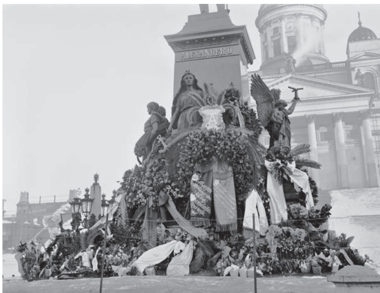
Bild 11. Blomsterhyllningen vid Alexandermonumentet på årsdagen av Alexander II:s död 13.3.1899.

till och med som en statskupp. Manifestet orsakade en rad protester, såsom insamlandet av den stora medborgaradressen, som emellertid aldrig nådde fram eftersom kejsaren vägrade ta emot deputationen. 73