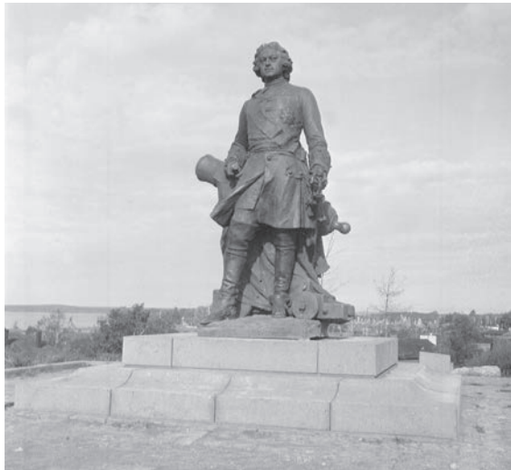
Bild 16. Peter den store på självständighetsmonumentets gamla sockel, antagligen fotograferad kort efter intagningen av Viborg 1941.

man inte nöjd med den nya monumentordningen och det 1927 invigda självständighetsmonumentet störtades så att både skulpturen och stora delar av piedestalen skadades (Bild 15). Kejsarstatyn forslades från museet till Tervaniemi och uppställdes på sin ursprungliga plats, denna gång utan någon egentlig piedestal (Bild 16). 120