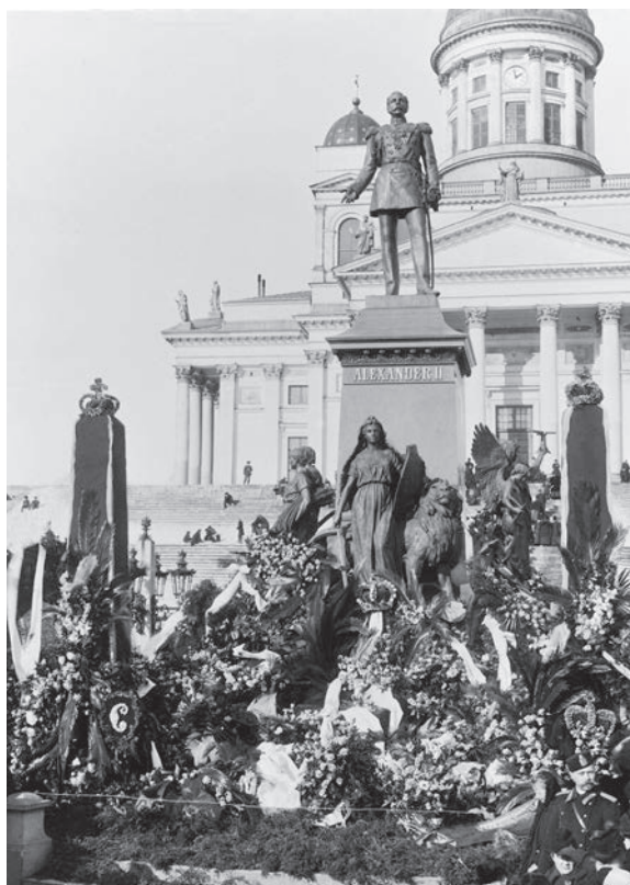
Bild 10. Blomsterhyllningen vid Alexandermonumentet i samband med utfärdandet av februarimanifestet 1899.