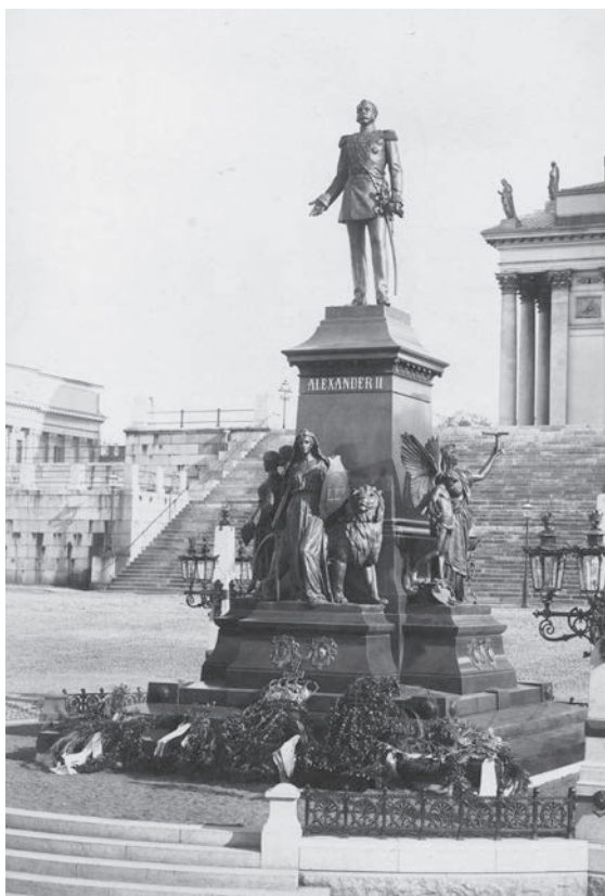
Bild 5. Monumentet över Alexander II, fotograferat efter invigningen 29.4.1894.

På monumentets sidor finns fyra skulpturgrupper: 1) Rättvisans vård ( Lex ), 2) Vetenskapen och Konsten ( Lux ), 68 3) Freden ( Pax ), och 4) Arbetet ( Labor ). Framsidan domineras av Rättvisans vård , en kvinnofigur iklädd björnfäll och antikiserande drapering. Hon står framför ett lejon och håller i sin sänkta högra hand ett svärd medan den vänstra stöder en sköld, som vilar på lejonets rygg. På skölden står med stora bokstäver LEX , det vill säga lag (Bild 6). Vetenskapen och Konsten är den skulpturgrupp som är vänd mot Senatshuset. Den större lagerkranskrönta figuren till höger är en kvinna iklädd all'antica . Hon står bredvid en jordglob och håller en spektrometer i sin vänstra hand. Den mindre figuren till vänster är en naken, bevingad yngling som håller en