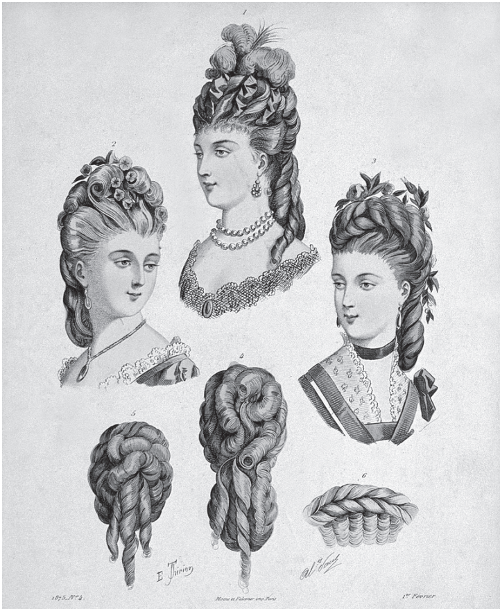
På 1860-talet blev den s.k. chinjongen, som bestod av en stor håruppsättning, en modefrisyr i Europa och USA. För kvinnor som ville följa hårmodet var löshår i slutet av århundradet ofta en förutsättning för att man skulle få till den rätta storleken på hårknoten. Bild: Revue de la coiffure 1875:4, E. Thirion, Wellcome Collection.

mästare och frisörer i S:t Petersburg. Där användes håret i huvudsak för att tillverka peruker samt valkar och lösflåtor för de avancerade frisyreer som var på modet. 117