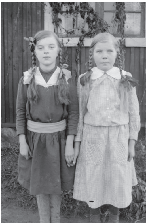
På 1870-talet uppmanade tidningar kvinnor och barn att vara aktsamma, eftersom deras långa flåtor kunde utgöra begärligt byte för kringstrykande hårhandlare.

Enstaka omnämmanden i finländsk press tyder på att även judar från Sverige köpte upp hår i Finland. Sommaren 1872 rapporterade exempelvis Wasabladet att fyra judiska uppköpare från Sverige rörde sig i trakten, medan Wiborgs Tidning nämnde att ett antal ”svenske judar, som skola vara håruppköpare till profession” vistades i Viborg. 24 I det senare fallet handlar det möjligtvis om samma judiska håruppköpare som i juni hade anlämt till staden åtföljda av tre lokala ”finska kvinnor”. Sällskapet hade enligt uppgift rest runt i Savolax och köpt upp hår, något som för kvinnorna hade varit en oangenäm upplevelse. Dels uppgavs ”Savolax-gubbarne” ha varit ”ytterst förbittrade” på dem efter att ha sett sina ”hustrurs och döttrars yfviga flåtor bortbytta mot någon simpel duk”, dels beklagade sig kvinnorna över att färden hade varit besvärlig eftersom sällskapet hade tillbringat nätterna i skogen av rädsla