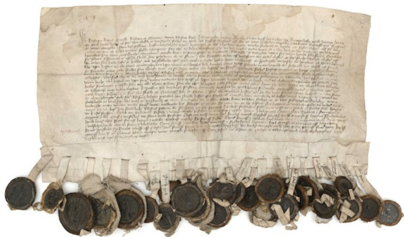
Nådendals klostrets grundläggningsbrev från riksrådets möte i Södertälje den 30 augusti 1438 med närvarande rådsmedlemmars underhängande sigill.

togs vid riksrådets möte i Södertälje den 30 augusti 1438. Det fanns dock redan planer på att grunda ett dominikanskt nunnekloster, men beslutet i Södertälje satte stopp för planeringen av klostret. Riksrådet ansåg alltså att ett birgittinkloster bättre än ett kvinnokloster av dominikanorden skulle möta allmogens behov, eftersom birgittinernas dubbelklosterkoncept bättre ansågs kunna sörja för nunnornas själsliga välgång, liksom också för allmänhetens genom prästbrödernas predikningar som allmänheten kunde åhöra i klosterkyrkan. 17