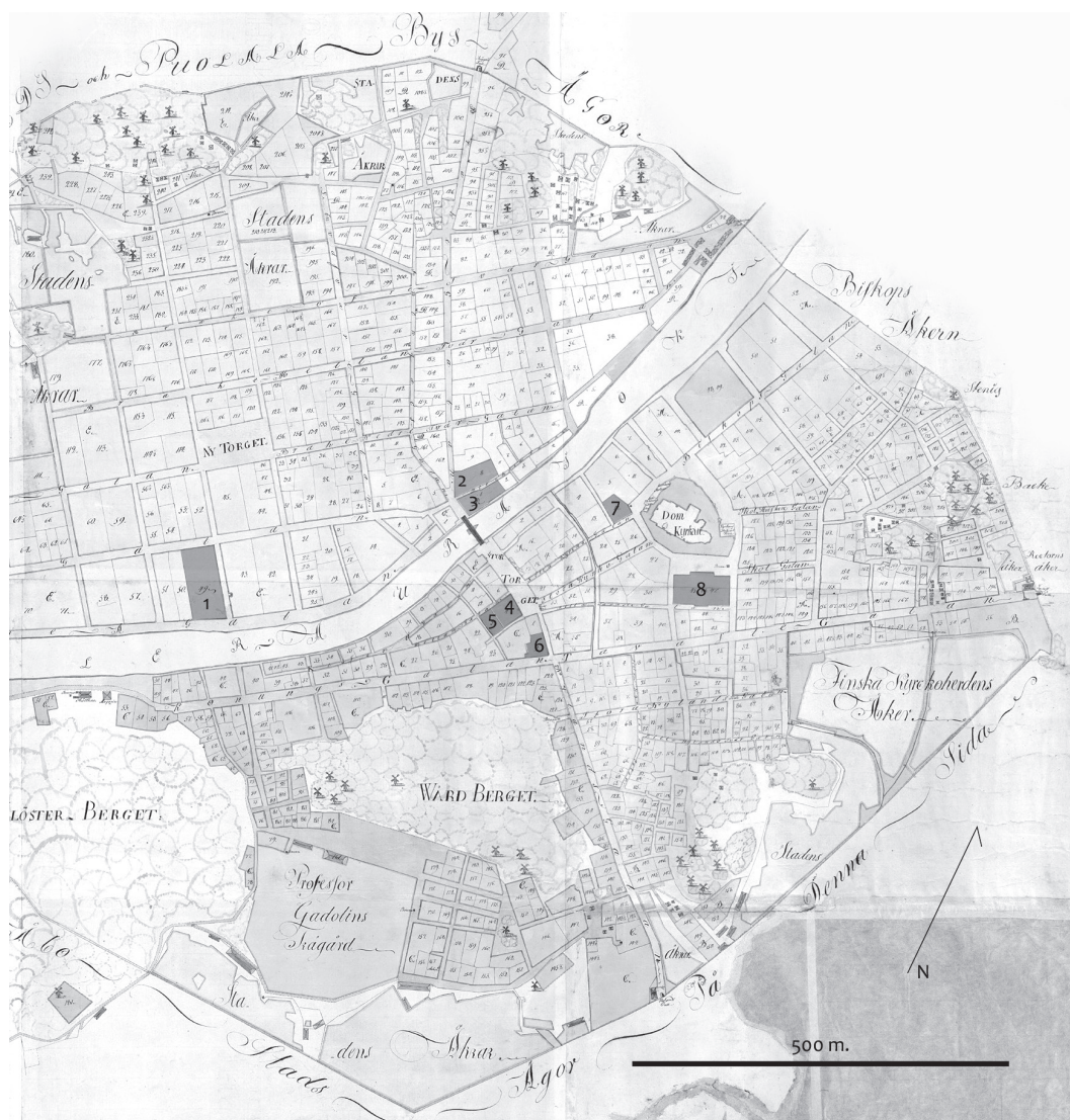
Tilbergs karta över Åbo från 1818. Panu Savolainen har bearbetat kartan.