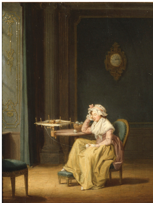
Fig. 10. Pehr Hilleström, Nysterska , c. 1780–1790. Olja på duk, 39,5 x 31,5 cm.

skildra den rofyllda stämningen i hemmet och livets små glädjeämnen i form av en liten tupplur utan att fliten, som hörde till den lutherska hustavlans värld, helt förvandlades till förkastlig sysslolöshet (fig. 10). 59 Målningen "Nysterska" påminner till sin komposition om "Vid nystvindan". En ung kvinna klädd i en elegant gammelrosa och gul dräkt, en ljus sjal med fransar och en mössa utsmyckad med ett rosa band har somnat med ett garnnystan i handen. Ljuset som strömmar in genom det stora fönstret och klockan på väggen understryker eftermiddagens sömniga rofylldhet. Förmakets eller salens gröna fönsterpaneler och väggar är prydda med förgyllda lister i rokokostil, medan det i ett hörn står en jonisk pelare som ett nyklassiskt inredningselement. Förändringen från tidiga franskinspirerade interiörer (fig. 1) mot en särpräglad, nordisk, avskalad och enkel måleristil är tydlig.