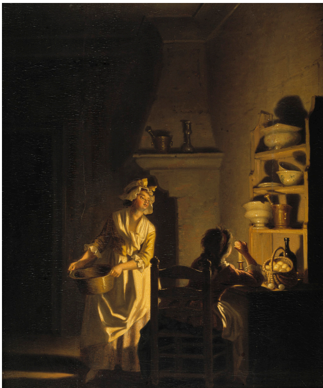
Fig. 2. Pehr Hilleström, Äggprovet. Köksinteriör, c. 1785. Olja på trä, 39 x 32 cm.

Hilleströms egenhändigt nedtecknade verkförteckning framgår kvinnornas sociala ställning av hurdana beskrivningar som används om dem. Det är mycket viktigt att använda verkförteckningen eftersom det inte alltid är självklart ens för en forskare som är specialiserad på den aktuella tidsperioden hur man ska skilja de modernt klädda högreståndsdamerna från deras lika modernt klädda tjänarinnor.