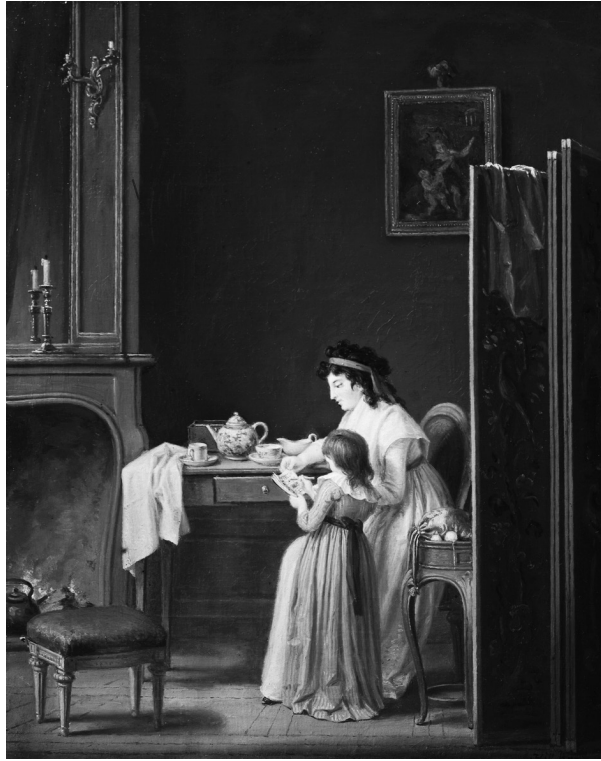
Fig. 19. Pehr Hilleström, En liten flicka undervisas i läsning av en kvinna , c. 1800. Olja på duk, 51 x 42 cm. Privat ägo. Foto: Nordiska museet. CC BY-NC-ND.

som tidsfördriv blev en del av högreståndslivsstilen. Bildmaterialet ger emellertid inte all information, och släktarbetet, som utfördes genom och med hjälp av skrivande, en text, blir summariskt skildrat på Hilleströms genremålningar. Hans målningar skildrar – eller dokumenterar – sysslolöshet och arbete som tidsfördriv bland den högre klassens kvinnor (för att inte tala om tjänstefolkets arbete), medan man får leta efter källor för kvinnors släktarbete på andra håll.