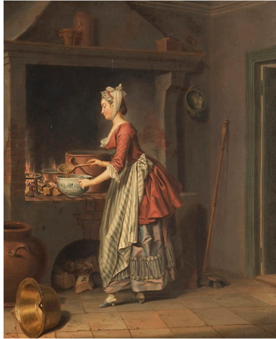
Fig. 1. Pehr Hilleström, En piga höser såppa utur en kittel – i en skål, 1770-talet. Olja på duk, 55,5 x 45 cm. Privat ägo.