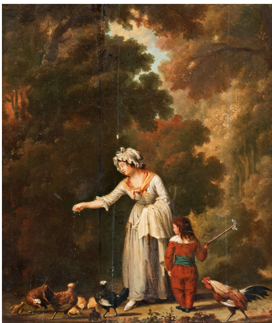
Fig. 6. Pehr Hilleström, Hönsmatning i landskap, 1790-talet. Pannå, 39,5 x 32,5 cm. Privat ägo.