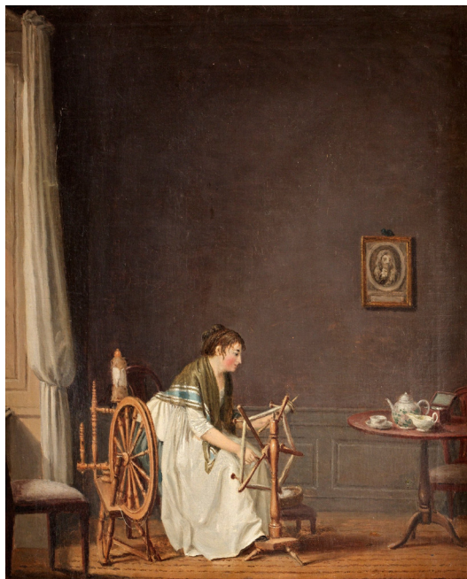
Fig. 9. Pehr Hilleström, Vid nystvindan , c. 1780–1790. Olja på duk, 51,5 x 42 cm. Privat ägo.