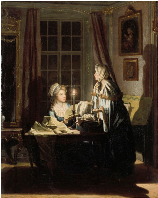
Fig. 14. Pehr Hilleström, Modehandlerska , c. 1790. Olja på duk, 79,5 x 65,5 cm.