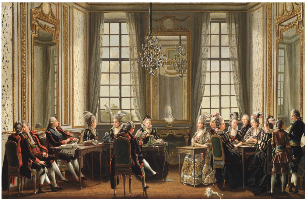
Fig. 13. Pehr Hilleström, Lektyr på Drottningholm, 1779. Olja på duk, 74,5 x 117 cm.

av det heteronormativa umgänget, och både kvinnor och män handarbetade. 67 Medan man handarbetade diskuterade man, eller lyssnade på högläsning. Handarbete var också en viktig del av livet och vardagen vid hovet. Drottningar, prinsessor och hovdamer överallt i Europa var skickliga på att brodera, och att sy eller utföra andra små handarbeten tillsammans ingick i hovens sociala värld. Det framgår särskilt tydligt av de av Hilleströms målningar som föreställer livet vid hoven och i den högre aristokratin (fig. 13), 68 även om temat som en del av hovens och aristokratins vardag egentligen inte, med undantag för några få omnämmanden, har analyserats i anslutning till Hilleströms målningar.