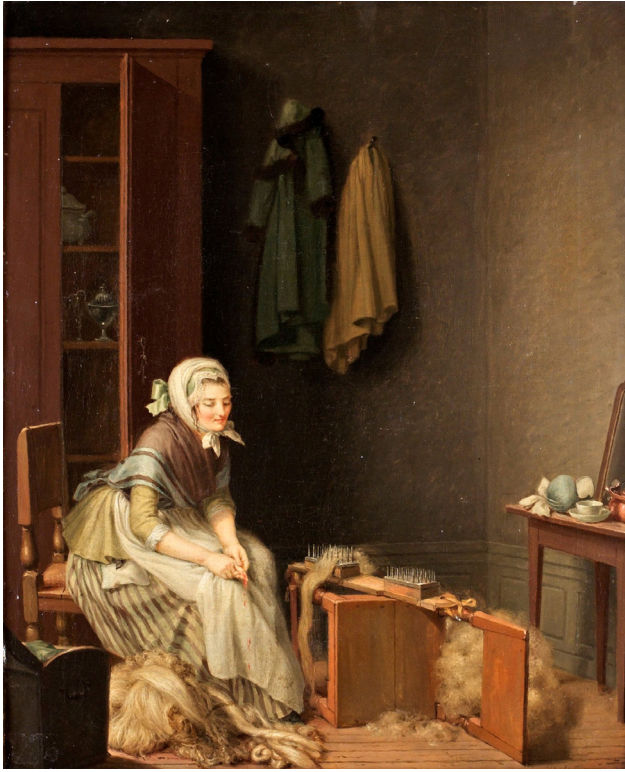
Fig. 8. Pehr Hilleström, En piga häklar lin, har skadat sitt finger på häkulan , 1798. Olja på duk, 51,5 x 42,5 cm. Privat ägo.

är motivet en syende kvinna, och på 43 är motivet något annat textilarbete, oftast olika arbetsmoment i anslutning till garnframställning (tabell 1). Särskilt ofta avbildade Hilleström kvinnor som spann, nystade eller lindade upp garn med en härvel. Dessutom kan man på många målningar som inte direkt föreställer sömнад eller textilarbete se en lite sypåse eller sykorg som påminner om vilken central plats sömнадen hade i kvinnors liv.