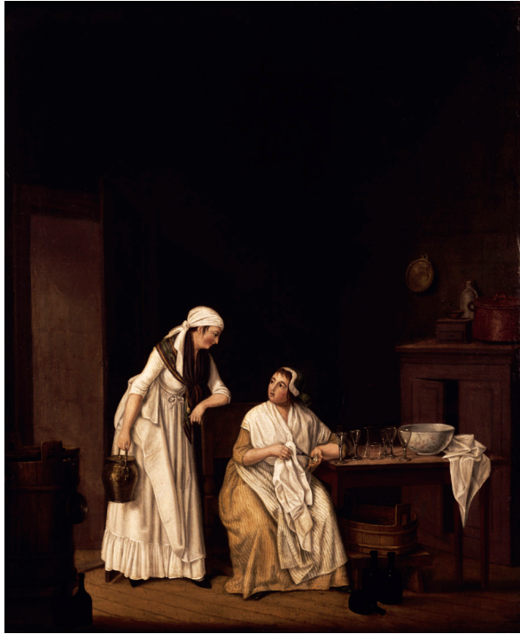
Fig. 4. Pehr Hilleström, Handkammerinteriör , 1790. Olja på duk, 54 x 45 cm. Foto: Stockholms stadsmuseum. CC BY-NC-SA.

Av alla Hilleströms målningar kan man säga att 130 ansluter till hushållsarbete och tjänstefolkets arbete (tabell 1). På 52 målningar skildras matförsörjning, matlagning eller konservering och diskning. På 33 målningar avbildas tvätt eller strykning, och på fyra städning. På nio målningar är motivet pigor, vars arbete inte beskrivs mer ingående och på åtta målningar utför pigor arbete utomhus. Köksmotiv hörde helt klart till Hilleströms favoriter, och han målade flera målningar med samma motiv. På målningarna framkommer klart hur sparsamt möblerade och inredda köken var på 1700- och 1800-talen. Ofta finns det ett enda ljus, som kvinnorna använder sig av för att kunna utföra sina sysslor. Tjänstefolkets arbete syns också på de 24 målningar där en eller flera tjänarinnor betjänar sin husmor. I tabell 1 har dessa ansetts höra förutom till hushållsarbete också till arbete som tidsfördriv, eftersom det är högreståndskvinnan och hennes liv som är i centrum, inte tjänarinnans arbete. Detsamma syns i beskrivningarna i verkförteckningen, där pigans eller kammarjungfruns roll är att vara i bakgrunden och garantera de yttre förutsättningarna för högreståndsfrens livsstil.