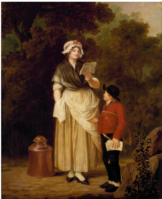
Fig. 7. Pehr Hilleström, Jungfru köper en kärleksvisa, c. 1796. Olja på duk, 120,5 x 89,5 cm. Foto: Åsa Lunden, Nationalmuseum, Stockholm. CC PD.