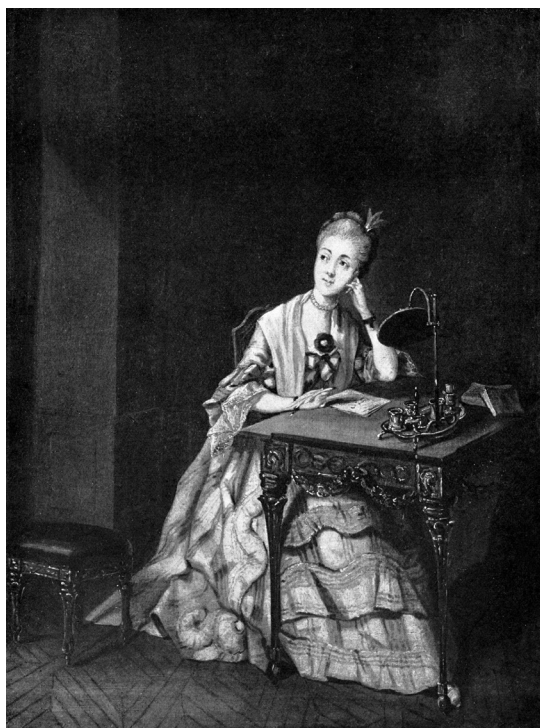
Fig. 18. Pehr Hilleström, Ett fruentimmer vid sitt skrifbord , c. 1775. Olja på duk, 38 x 29 cm. Ur Gerda Cederblom, Pehr Hilleström som kulturskildrare I, 1927.

På fem av målningarna i Pehr Hilleströms verkförteckning är motivet brevskrivning och på tretton är motivet läsning av brev (tabell 1). Enligt verkförteckningen är tre brev kondoleansbrev, ett är ett kärleksbrev och om de övriga åtta sägs att kvinnor antingen läser eller håller brevet i handen. En av målningarna med ett brev ingår i Gerda Cederbloms planschverk, men inte i Hilleströms verkförteckning. 92 Anledningen till kondoleansbreven kan ha varit att en släkting, en make eller maka, ett barn eller en älskad dött.