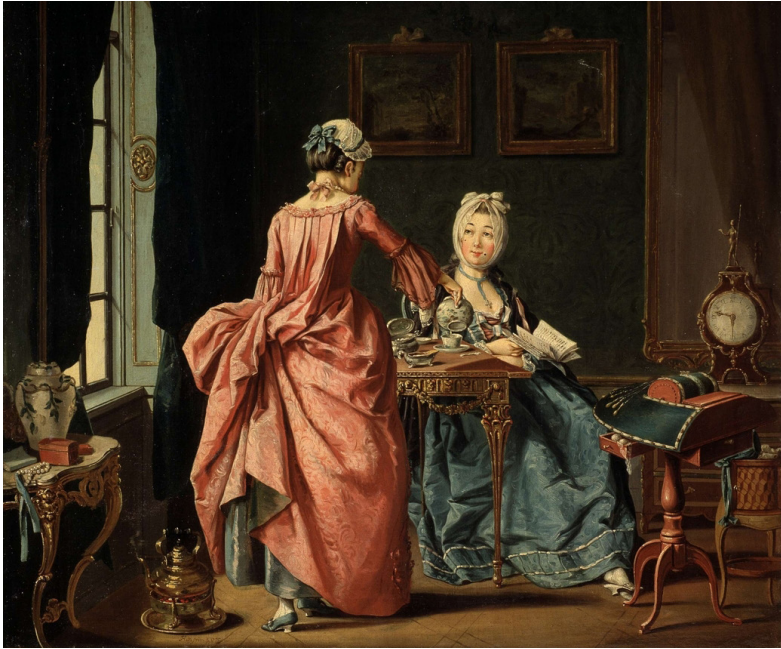
Fig. 17. Pehr Hilleström, Ett fruentimmer sitter och läser, kammarjungfrun kommer med Thé , 1775. Olja på duk, 52 x 65 cm. Foto: Birgit Brånvall, Nordiska museet. CC BY-NC-ND.

spegeln. 88 De föremål med vars hjälp den aristokratiska livsstilen skapades, var konstverk som krävt mycket arbete av hantverkaren. Föremålen, möblerna och textilierna skapar en stämning där frun kan koncentrera sig på sin testund och på att läsa sin bok, och på att genom arbete som tidsfördriv konstruera de privilegierade klassernas livsstil.