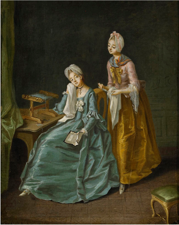
Fig. 3. Pehr Hilleström, Ett fruentimmer som sitter och gråter, samt hennes jungfru som inkommer med en lucktflaska , 1770-talet. Olja på duk fäst på pannå, 39 x 29,5 cm. Privat ägo.

dem är signerade, en del osignerade. Utifrån det material jag har studerat målade Pehr Hilleström åtminstone 262 målningar med kvinnors arbete som motiv. I tabell 1 ingår de olika slag av arbete som Hilleström avbildade på sina målningar och som är föremål för analys. I tabellen uppgår antalet motiv till 305, eftersom Hilleström på en del målningar avbildar två slag av arbeten. 40 Dessutom föreställer de verk som hör till kategorin ”att betjäna frun” såväl tjänstefolkets som husmödrarnas arbete.