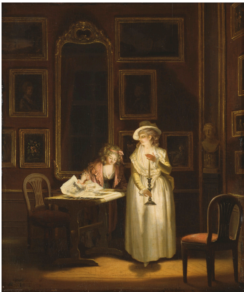
Fig. 12. Pehr Hilleström, Vid sybågen , c. 1790. Olja på trä, 39,5 x 33 cm. Foto: Åsa Lunden, Nationalmuseum, Stockholm. CC PD.

Sömnad var i alla stånd och i alla socialgrupper en betydande del av kvinnors kollektiva arbete och samarbete och ett sätt att föra vidare kunskap, kunnande och traditioner. Sömnadsarbetet var inte heller begränsat till hemmet eller till den plats där man arbetade, utan kvinnor sydde också när de befann sig på besök någonstans eller ibland utomhus om det var vackert väder. 66 Inom eliten var handarbete en del