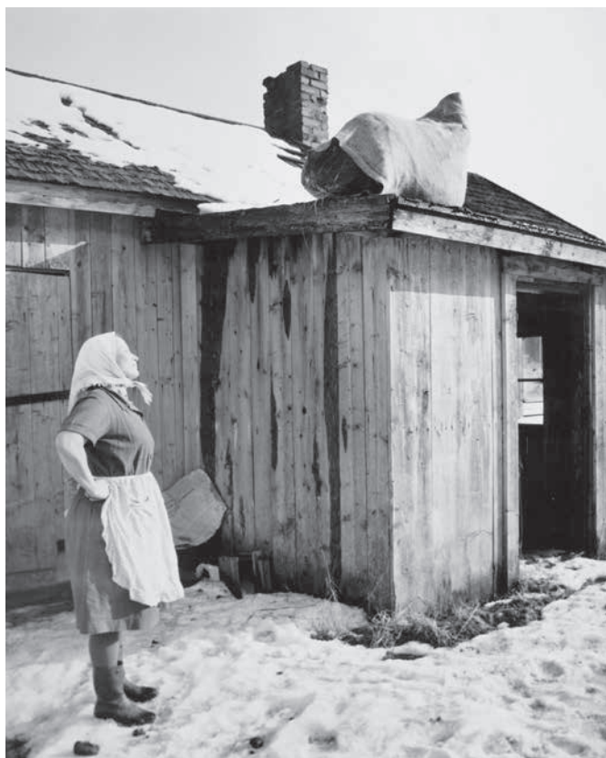
Påskmagi från år 1963: en bondehustru har på skärtorsdagen år 1963 bemödat sig med att klättra upp på taket på ladugården och där lagt en hösäck, säkerligen i syfte att värja boskapen mot häxor.

Trots att signeri och lövjeri vanligtvis hade positiva ändamål, bekämpades all magi av kyrkan. Under 1600-talet stämplades signeri och lövjeri ofta som vidskepelse av prästerna och de boklärdas samt domstolarna. De styrande skikten gjorde således – åtminstone i offentligheten – gällande att sådana former av magi inte var lika verkliga som trolldom och att det bara var de utbildade som av okunskap trodde på att sådana handlingar hade en verkan. 65