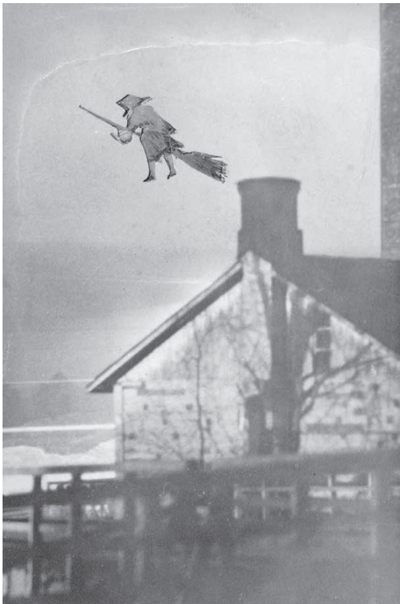
Den iscensatta bilden från år 1930 återspeglar långlivade föreställningar om häxor som flyger med sina kvastar till Blåkulla.