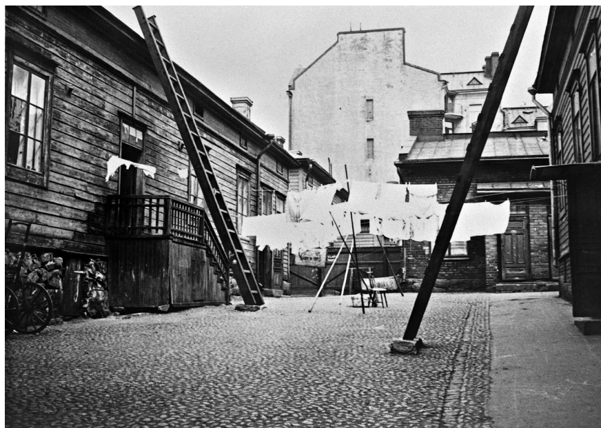
Hembesök var en av välgörenhetsföreningarnas viktigaste verksamhetsformer. F.V.O.:s hembesökare besökte regelbundet Helsingfors arbetarbostäder och intervjuade familjer som anhöll om hjälp. Styrmansgatan låg i ett av de områden i staden där hjälpbehoven var som störst. Foto: W. W. Wikman 1935, Styrmansgatan 11; Helsingfors stadsmuseum.

föreningarna upprättade rutiner för detta. F.V.O.:s hembesökare inspekterade bidragssökandes levnadsförhållanden, genomförde intervjuer och fyllde i ansökningsblanketter i hemmen. På basis av blanketterna uppgjordes rapporter till den kommitté som fattade beslut om hjälp. Hembesöksinstitutionen var även en oskiljaktig del av bidragssystemet då det fanns ett stort antal bidragssökande som inte själva kunde besöka hjälporganisationens byrå eller framföra en skriftlig anhållan. På bruksorter var hembesöken i en nyckelroll inom mödra- och sjukvården. Genom att förbättra individens kunskap om hygien gjordes hemvården mera effektiv. Till skillnad från stora nationella organisationer inom vård och omsorg stod de lokala föreningarna dessutom i nära kontakt med den befolkning som de understödde. Som vi ovan nämnde var hembesöken ofta en fråga om kontroll och uppfostran, men hembesöken hade även mycket praktiska funktioner.