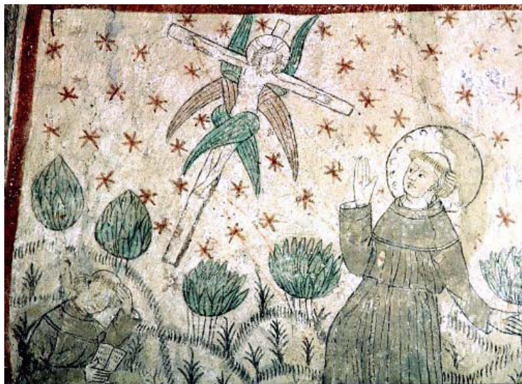
Franciskus i Arboga kyrka (Västmanland), 1400-talets första hälft.