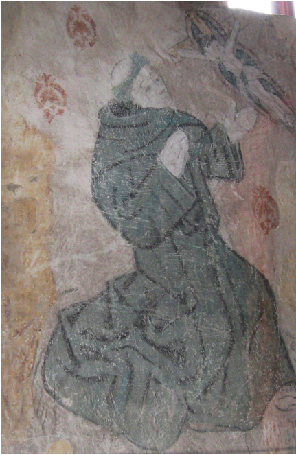
Franciskus i Heliga korsets kyrka, Hattula, 1510-tal.

och Lund; i Sverige i två: Linköping och Stockholm; i Norge fanns en, som ofta har benämnts efter Bergen. Konventen i Åbo stift tillhörde Stockholms kustodium. 4