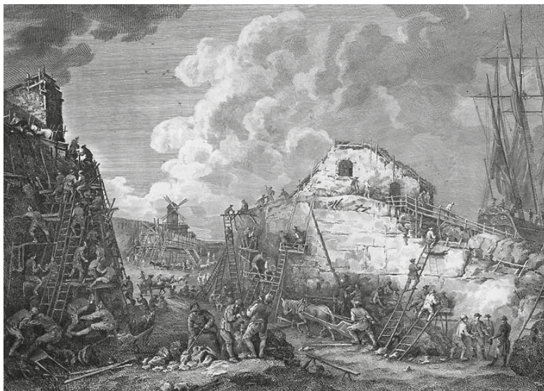
Elias Martin, Sveaborgs galere-docka , 1782.

muntrades at anlägga nya Wärk. Detta kunde inte gå i wärkställighet, utan dryga förskätter.” 41 Detta kan tolkas som att förskott till tegelbruken var en normal kutym, som väsentligen bidrog till deras driftskapital. Fortifikationen verkar också ha varit aktivt ute och letat efter villiga nya industriidkare, som man erbjöd pengar för att kunna köra igång med verksamheten.