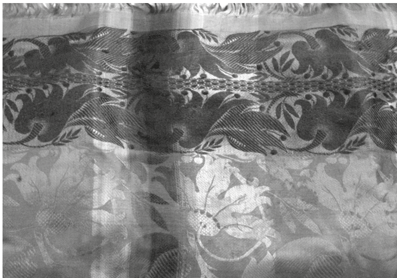
Sidensjal från 1700-talet. Privat samling.

riket hade koncentrerats till Stockholm. 23 Förutom nymodigheter och frukter som med största sannolikhet fann sin väg till borgarhemmen, kan Gamlakarleby stad och den omkringliggande landsbygden karakteriseras av en öppenhet för influenser utifrån.