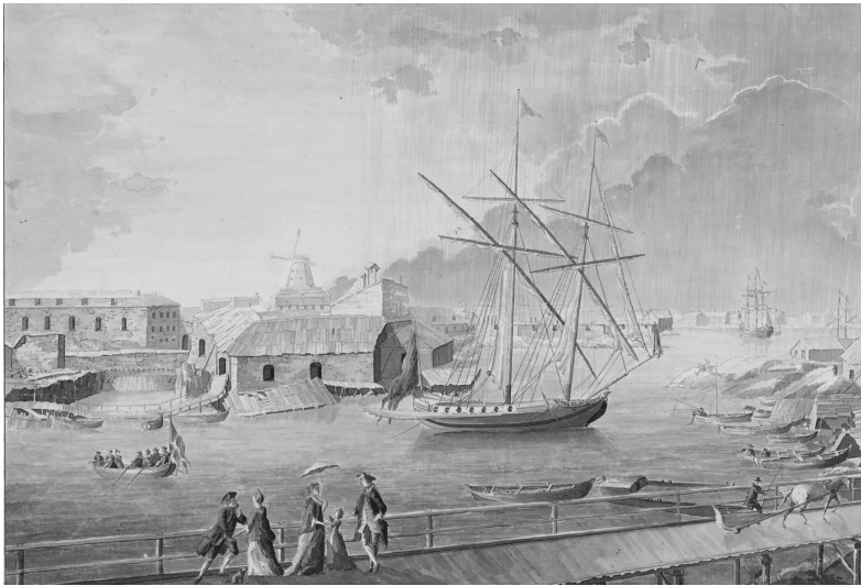
Utsikt från bron mellan Stora Öster Svartö och Vargön.

nyttjanderätten till de två tomterna mot ett årligt arrende. 62 I praktiken lyckades alltså Myhr få tegel och en av stans bästa tomter av Fortifikationen mot ett årligt arrende på 25 daler silvermynt, för vilket han dessutom fortfarande hade nyttjanderätten till fyra andra tomter i staden.