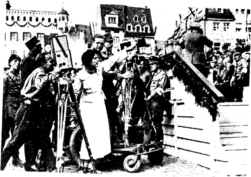
Filmklubben Projektio visade även Leni Riefenstahls film Triumph des Willens . Efteråt hävdade klubbens ledning att detta skedde i avsikt att skapa politisk balans, men man kan även se visningen i ett sammanhang där det nya, framtiden, var av intresse och klubben därför ville bekanta sig med andra alternativ än det sovjetiska och franska. På bilden regisserar Riefenstahl filmen som handlar om nazisternas partidag i Nürnberg.

Det är intressant är hur svag och otydlig gränsen var särskilt mellan de estetiska framtidsvyer som formulerades av "de svarta" och "de röda" på 1930-talet. Problemet för dessa intellektuella på vardera sidan verkar ha varit den nya massan, hopen, den nya urbana människan. Örnulf Tigerstedt uttrycker i förordet till sin diktsamling Vid gränsen (1928) önskemålet att hans dikter skall ses som arkitektonisk prosa. Göran O:son Waltå betonar draget av kontroll i Tigerstedts estetik och det finns naturligtvis skillnader mellan svart och röd estetik, men samtidigt verkar det åtminstone vid en ytlig jämförelse som om det tidstypiska problemet med att behärska den nya tiden, framtiden, skulle överskugga den politiska estetiken på såväl höger- som vänsterkanten. Waltå antyder även en kommunikation mellan Hagar Olsson och Tigerstedt. Han lyfter fram dyrkan av tekniken, kraften och handlingen i Tigerstedts estetik och på detta reducerade plan ligger en högeraktivistisk estetik inte särskilt långt från den filmintresserade vänsterns