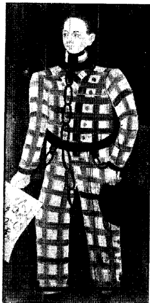
Fånge på Åbo slott målad av en okänd medfånge under 1800-talet, Åbo landskapsmuseum.