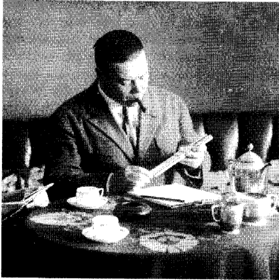
Räknesticka och cigarr. Propaganda i den illustrerade pressen 1924. Försvarsministern hemma hos sig med ingenjörinsignier.

igenom frågor gällande finländska förhållanden och finländarnas attityder. Härvid aktualiserades givetvis också en indragning av skyddskårerna. Man antog att en sådan åtgärd kunde medföra protester, kanske t.o.m. en risk för en kupp, inte minst därför att organisationen stod nära den centrala auktoriteten i landet, presidenten-överbefälhavaren Mannerheim. 12 Denne flaggade också öppet för att organisationen skulle skonas.