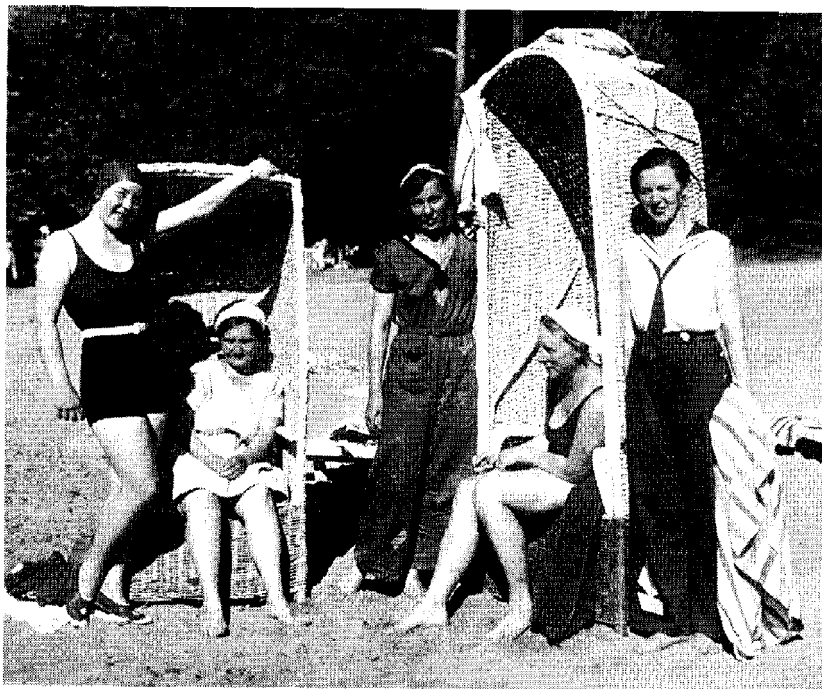
Gymnastikinstruktörer under en kurs för lottor i Näddal år 1932.