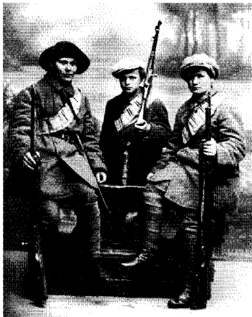
Kvinnliga rödgardister i uniform.

försvinner, manligheten räddas enbart genom att med sångens hjälp klamra sig fast vid nationens gestalt.