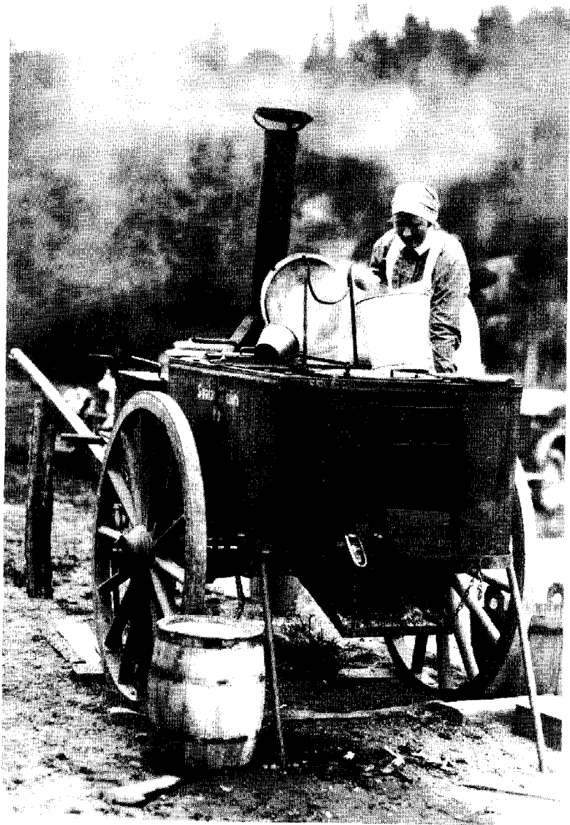
Lotta vid ett fältrök under en skyddskårsmanöver i Sordavala på 1920-talet.