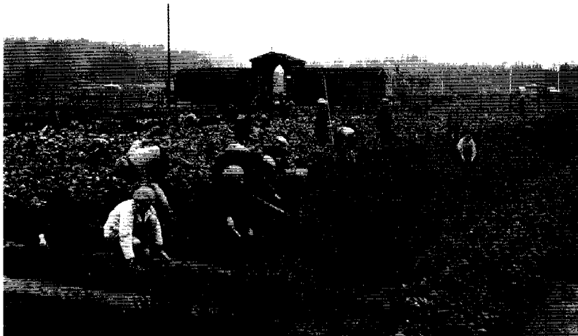
Organiserat barnarbete för att hålla barn borta från gatan. Folkskolebarn på trädgårdskolonin i Gumtäkt i Helsingfors under sommarlovet på 1920-talet. Observera läraren i bakgrunden som i sin korrekta kostym övervakar barnens arbete.

rioder med andra världskriget som skiljelinje; kriget blev också annars en vattendelare i mångt och mycket i Finland och ute i världen. Jämfört med dessa stora förändringar ter det sig inte särskilt rimligt att lyfta upp en eller två lagar gällande barnarbete som på något sätt avgörande. Lagen om läroplikt bidrog kanske mera till att barnens försvann ur arbetskraften, men då kvarstår ändå frågan varför folkskolans genombrott skedde så sent och utdraget i Finland.