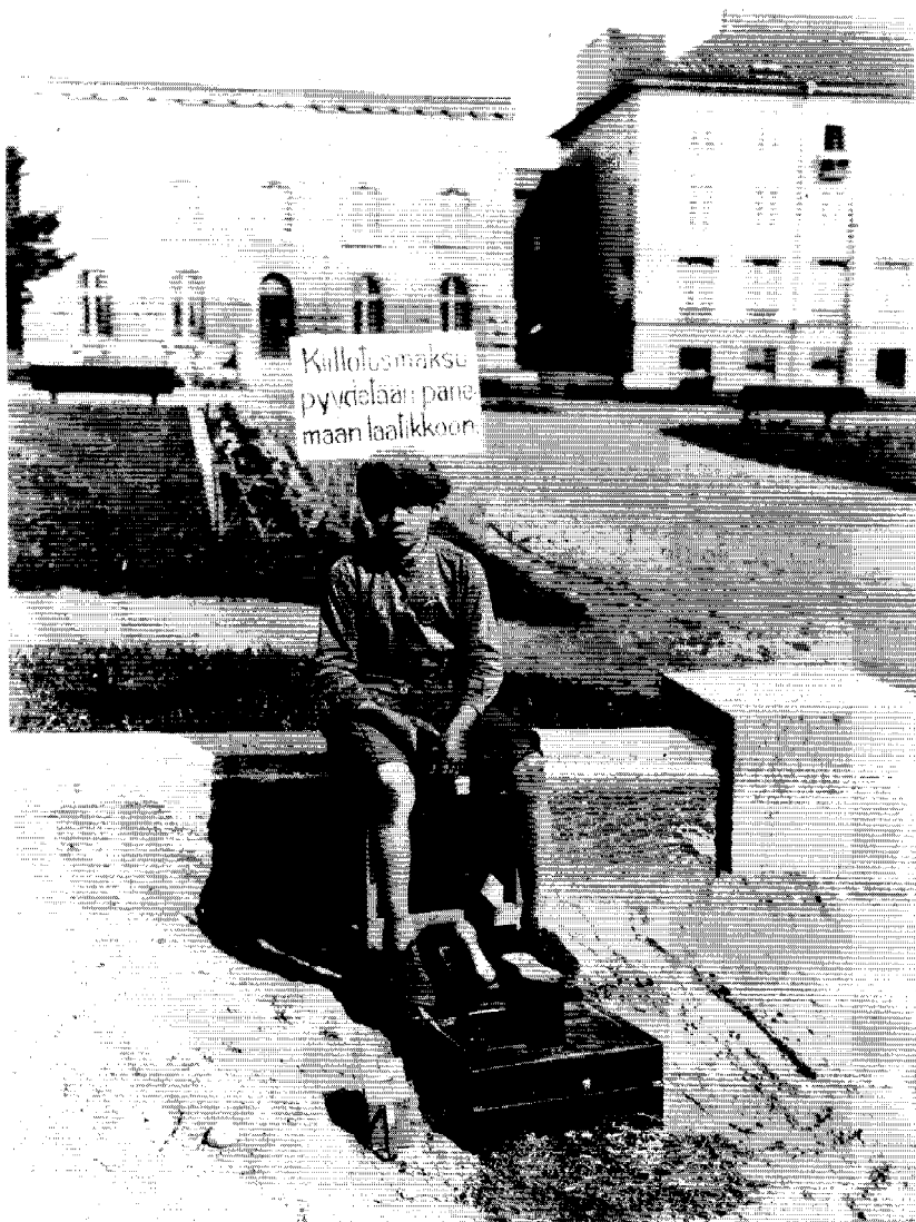
Accepterat barnarbete på gatan. En ung skoputsare sitter och väntar på kunder i Viborg på 1920-talet. På skylten uppmanas kunderna att lägga betalningen i en låda. Detta antyder att pojken inte var en fristående företagare utan hade en uppdragsgivare som fordrade redovisning för förtjänsten.