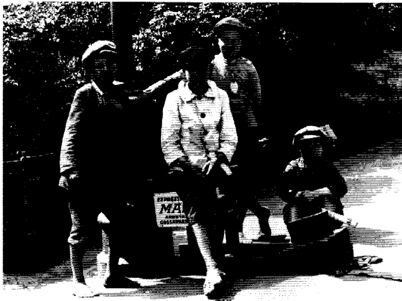
Reglerat barnarbete på gatan. Barfota gossar i Esplanaden i Helsingfors centrum år 1923. På sitsen står det Expressbyrån Mars. Mars tillhörde Kristliga Föreningen för Unga Män, som av Helsingfors stad erhölet rättigheten att dela ut blankningsrättigheter till fattiga pojkar.

nerellt övergick från spannmålsodling till kreatursbruk fr.o.m. de sista decennierna på 1800-talet och av att maskiner ersatte pojkar i fabrikena.