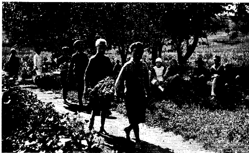
Trädgårdsarbetet i Gumtåket kunde också vara roligt när solen sken, ingen lärare fanns inom synhåll och man hade tid att vila i skuggan. (J. Lindh, Helsingfors stadsmuseum)

Sandin beskriver sekelskiftets barndomsideal som "sörgårdsidyll utan klassmotsättningar och sociala problem", med lek och ordnad skolgång, medan ett "arbetande barn per definition var ett exploaterat barn – exploaterat inte endast av företagare utan också av föräldrar vars kortsiktiga försörjarperspektiv gick ut över barnens framtid." Och enligt honom kom barns arbete på landsbygden "i konflikt med kraven på ordnad skolgång". 41 Mycket av det som karakteriserade barns vardag i Sverige kring sekelskiftet stämmer väl överens med barns erfarenheter i Finland. Som Viviana Zelitzer så träffande beskriver från andra håll i världen, förvandlades många unga pojkar och ynglingar "from useful to economically useless". 42