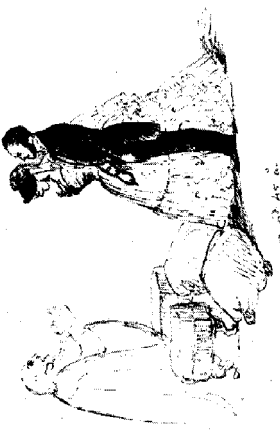
"Kärleken vid 15 år ... vid 70 år". August Mannerheims tuschteckning ger inte en fördelaktig bild av kärlek mellan generationer.