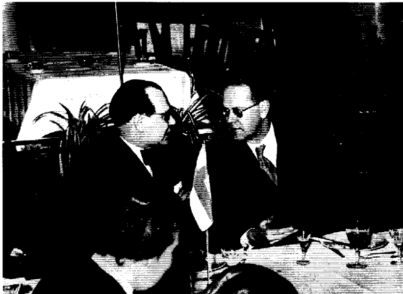
Tage Erlander och K.-A. Fagerholm under Erlanders besök i Helsingfors i mars 1947.