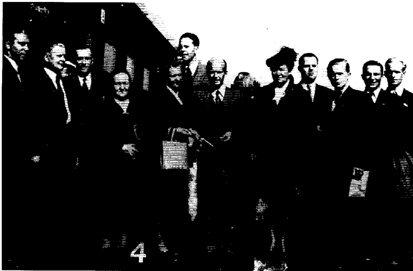
Den finländska delegationen som reste till arbetarkongressen i Oslo på sommaren 1947.

finnska arbetarakademin i Grankulla. Enligt Leskinen gällde den fullständiga suveräniteten inte längre efter det andra världskriget: