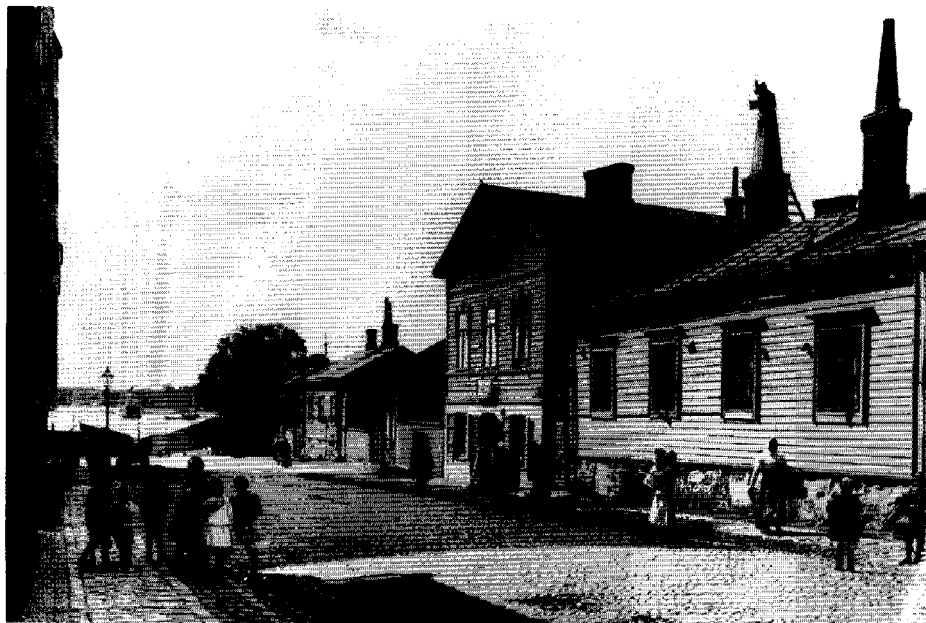
Rölbergsgatan 19–23. På gatan kunde barnen vara fria. Där lekte, tiggde och snattade man. Enligt myndigheterna var livet på gatan en fara – både för barnen och för samhället. Man ville ha barnen bort från gatan och placerade dem för disciplinering i skolor, arbetshus och uppfostringsanstalter. Foto: Signe Brander 1907. (Helsingfors stadsmuseums bildarkiv).

detta i stort sätt kan förklaras med att dessa barn framstod som blivande medlemmar av farliga klasser. 15