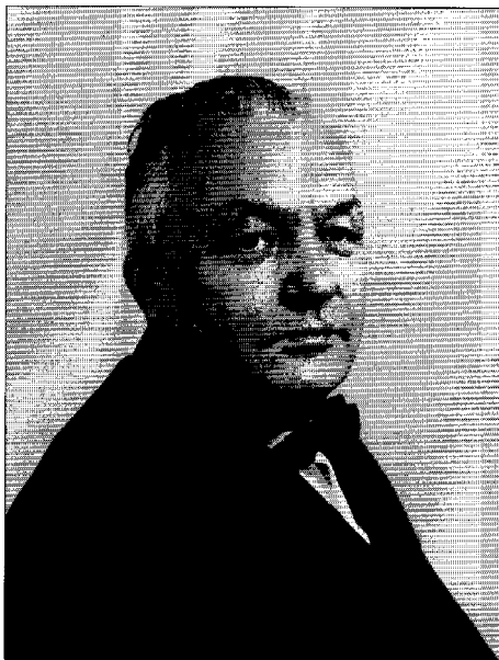
Minister V.J. Sukselainen var Folkpensionsanstaltens generaldirektör under åren 1954–1971, en av Kekkonenerans starka män och en av det finska pensionssystemets arkitekter. (Folkpensionsanstaltens arkiv).

av två motsatta pensionspolitiska läger. I synnerhet det socialdemokratiska fackförningsfolket har ända fram till våra dagar kommit ihåg stiftandet av 1956 års lag som ett praktexempel på agrarförbundets och dess efterföljares politiska list. Motsatsförhållandet ledde till att landet i början av 1960-talet fick ett arbetspensionssystem vid sidan av folkpensionssystemet. Mellan systemen uppstod en rivalitet som av de inblandade också har kallats ett krig eller en gytjebrottning. 26