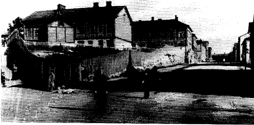
En polis bevakar livet norr om Långa bron, i hörnet av Porthansgatan och Tavastvägen (i dag Broholmsholmsgatan). Foto: Signe Brander 1908. (Helsingfors stadsmuseums bildarkiv).

några medlemmar. 67 De ömsesidiga relationerna kunde bli mycket intima. Man levde i nästan familjemässiga förhållanden med varandra. Modellen fungerade bra beträffande vardagslivets organisering: boende, matlagning, barn tillsyn, ärenden o.s.v. Man höll kontakten också under fängelsevistelser, när man var sjuk eller befann sig på vårdanstalt. Vertikal integrering är en särskilt viktig metod för att skydda sig mot yttre fiendliga attityder. "Gängets" medlemmar skyddade varandra. När myndigheterna försökte splittra subkulturer, höll de här "sub-undergrupperna" ihop och byggde eventuellt upp en ny grund för subkulturen.