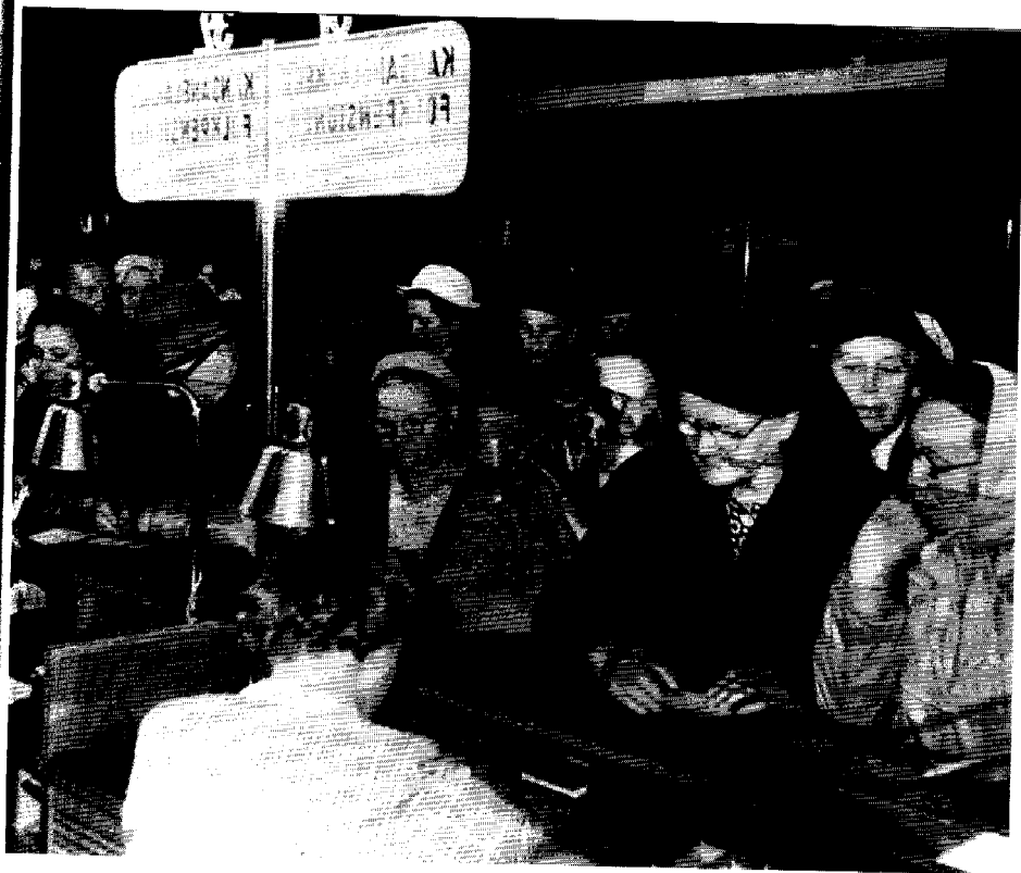
Pensionärer lyfter folkpension i Huvudposten i Helsingfors, juli 1954. Vid den här tiden utbetalades pensionen kvartalvis. Redan då folkpensionen infördes stod arbetar- och jordbrukarintressen mot varandra. I dag aktualiserar debatten om medborgarlön samma konflikt.

ta emot ett anvisat arbete. Arbetsgivarna tolkade inkomstgarantin som ett steg mot en medborgarlön, och varnade för att det skulle bli svårt att få arbetskraft i framtiden, om en sådan reform genomfördes. Också enligt FFC borde utredningen ha gjorts utgående från helt andra premisser. Socialskyddet borde uppmantra folk att arbeta och främja den fulla sysselsättningen. 48