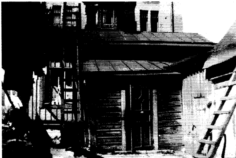
Länge menade man att den undre världen endast utgick från stadens fattigaste befolkning som bodde trångt och ohälsosamt i särskilt illa beryktade stadsdelar. Stora Robertsgatan 36. Foto: A. Rönneberg 1924. (Helsingfors stadsmuseums bildarkiv).

MacDonald själv definierar begreppet underklass på följande sätt: