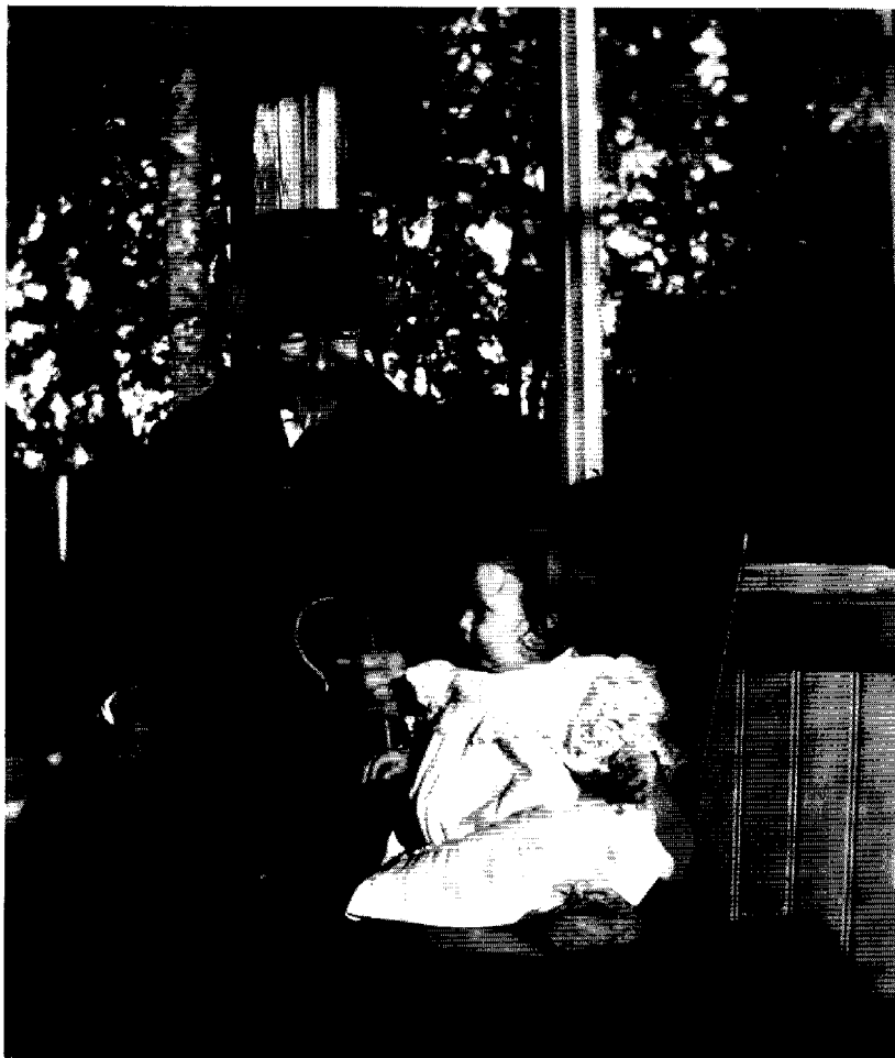
Zacharias Topelius med sitt barnbarnsbarn på Nybergs veranda. För Topelius representerade barnen en återglans av den nya, "hela" människan och Guds kommande rike på jorden.

Jag föreställer mig barndomen ungefär som spegelklodet i våra trädgårdar; lifvet kastar sten efter sten derpå och lyckas slutligen söndra bit efter bit; men hvarför påskynda denna oundvikliga förstöringsprocess? Spegeln skall nog mulna af sig sjelf genom tidens åverkan, men så länge den är klar, innebära dess illusioner icke blott mera skönhet, utan ock mera sanning, än skärfvorna af en verld i spillror. 11