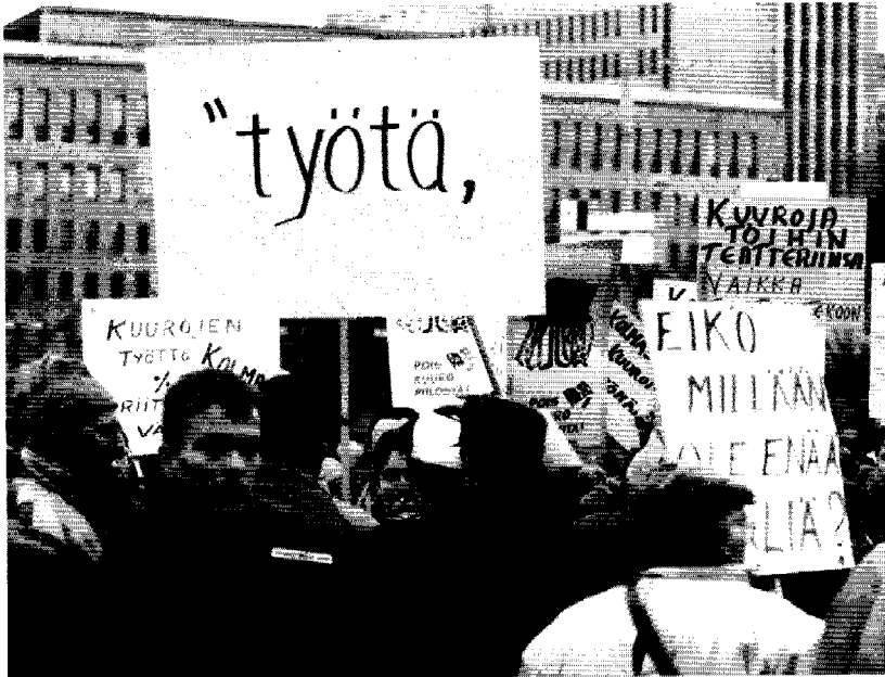
Työtä – Arbetet! De arbetslösa demonstrerar utanför riksdagshuset hösten 1993.

gången till ett "arbetsfritt" samhälle. Frågan om finansieringen är knappast heller i första hand en "teknisk" fråga, som Ekstrand vill se det. Den politiska beredskapen att gå in för en medborgarlön är nog i allra högsta grad beroende av det sätt på vilket den skulle finansieras.