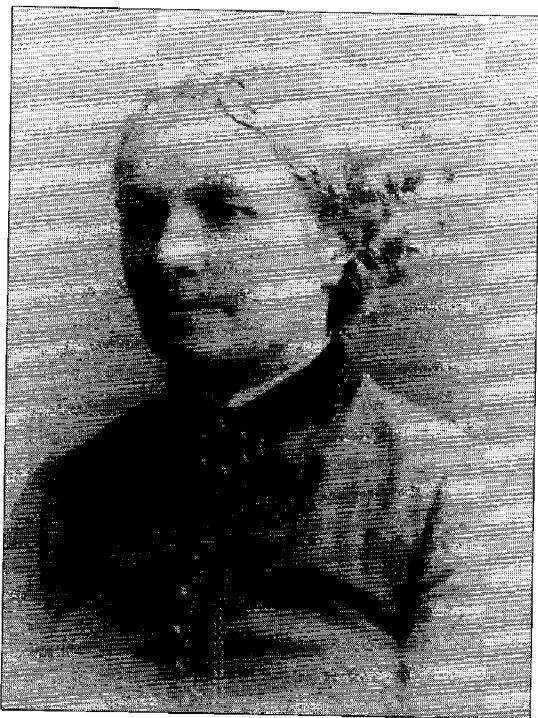
Fanny Palmén (1842–1905) tog initiativ till arbetshusen för barn i Helsingfors och undervisade tidvis också själv i en skola för nödlidande barn.

Fröken Fanny Palmén hade helt klart för sig hur ett arbetshus för fattiga barn borde organiseras. Som vägvisare hade hon en liten handskrivna promemoria, 24 vars första sats löd: "Grundprincipen vid arbetshuset är: ingen mat utan arbete." Hon hade också gjort upp en förteckning över de arbeten som barnen skulle utföra: drev- eller lappspritning, 25 mattflätning och sömnad samt lagning av egna kläder och skoplagg. Gossarna skulle också svarva och tillverka leksaker och flickorna spinna, karda, sy och fläta halm. För det mesta var det alltså fråga om ett redan föräldrat och föga lönsamt arbete. Det var knappast längre särskilt nyttigt kunskap i en stadsmiljö, men första generationens stadsbarn var förtrogna med sådana arbeten från landsbygden.