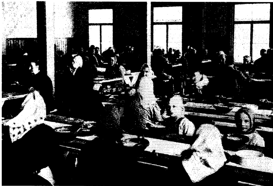
Helsingfors stads arbets- och fattighus år 1907. Längre gjorde man inte skillnad mellan fattiga och utblottade barn och vuxna. Här bespisas barn och vuxna tillsammans i samma sal.

jarens ansvar för barnet lätteligen minskas ...” 44 Under livsmedelskrisen 1917 höjdes avgiften till 10–25 penni per barn och ”mycket stegrade priser” angavs nu som enda förklaring. Barnen måste också hämta ransoneringskort hemifrån till arbetshuset, för anskaffning av gryn och mjöl till de gröt- och välningmål som barnen sedan bjöds på. 45