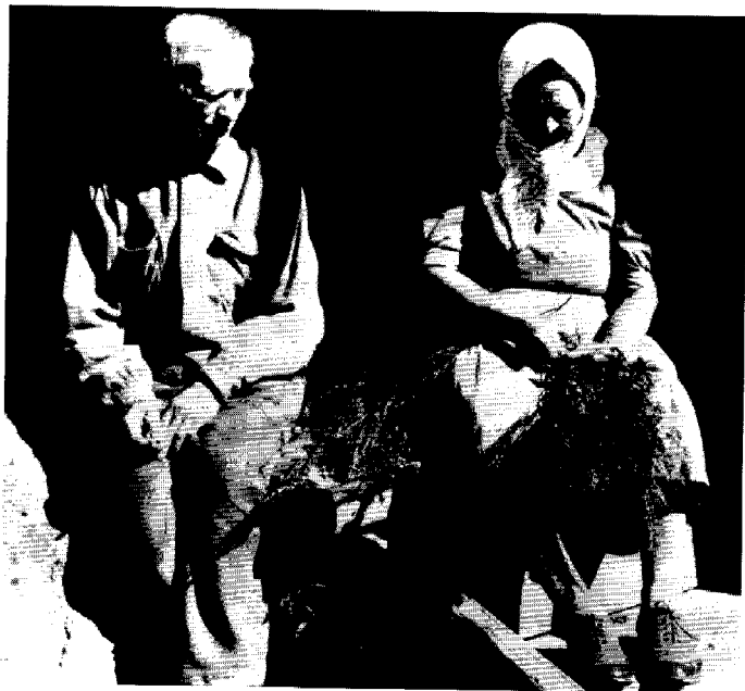
På 1950-talet bidrog ännu en stor del av pensionärerna själva till sin försörjning med någon form av arbete.

pensionerna som ytterligare krympte av den efterkrigstida inflationen. Under de första åren av 1950-talet räckte den genomsnittliga folkpensionen till omkring tre kilo kaffe per månad. I praktiken var de fattigaste pensionstagarna alltjämt hänvisade till hjälp från den kommunala fattigvården.