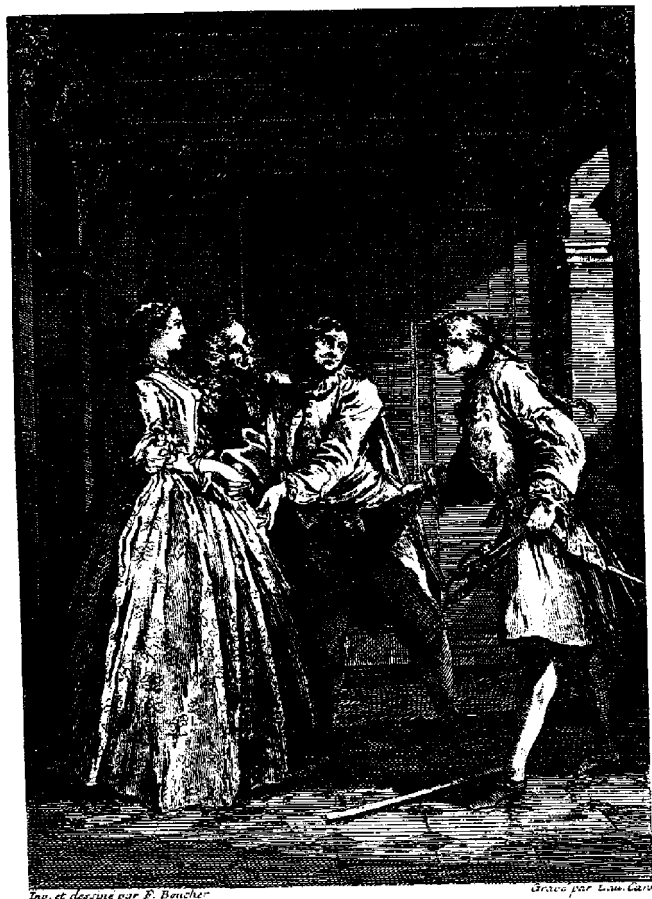
Ur François Bouchers illustrationer till Molières komedier.

också den franska kungen deltagit i grevinnans spektakulära tillställningar i hôtel Soissons. 5