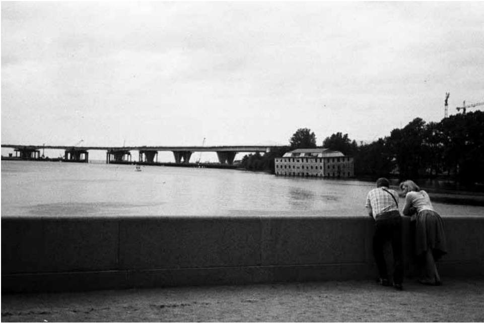
Näkymä länteen Jelagininsaaren päästä kun Pietarin ohitustietä ZSD:tä rakennettiin. Kamera: Smena 8M.

Vielä 1920-luvulla Vladimir Majakovski joutui kuljettamaan ulkomaanmatkaltaan valokuvaaja Aleksandr Rodtšenkolle uudenaikaisen saksalaisen Leica-kameran. Seuraavalla vuosikymmenellä ja varsinkin 1950-luvulta eteenpäin neuvostokamerat alkoivat jo kuitenkin olla niin tasokkaita, että niitä päinvastoin vietiin joskus ulkomaille. Neuvostoliitosta loikkausta suunnittelevien parissakin tiedettiin yleisesti, että Zorki-kameroita arvostettiin Keski- ja Länsi-Euroopassa ja niitä kannatti ottaa mukaan voidakseen myydä ne lännessä.