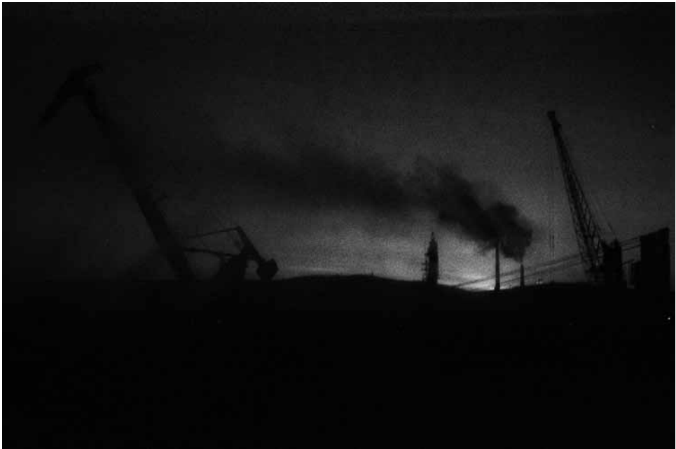
Murmanskin satama-alue likaisen ikkunan takana. Kamera: Lubitel 166.

Zorki oli tehtaan lippulaiva. Se oli aluksi räikeä jäljitelmä Leica-II-kamerasta aina etäisyysmittaria myöten, mutta myöhemmin tehdas kehitti Zorkista itsenäisen version. Zorki-6, jota tuotettiin 1960-luvun taitteen molemmin puolin, on omista neuvostokameroistani yleisimmin käytössä. Kuljetan sitä mukani miltei kaikkialla.