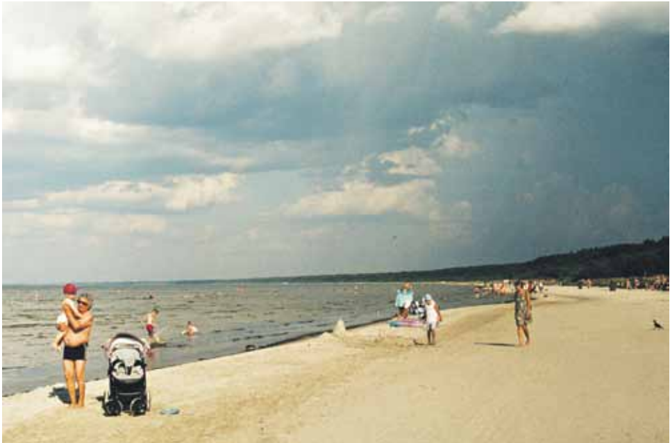
Jurmalan rantaa Latviassa vuoden 2020 kesällä. Kamera: Zorki-6.

Ostin ensimmäisen neuvostoaikaisen filmikamerani 2015 asuessani osan vuodesta Pietarissa. Sitä seurasivat nopeasti uudet hankinnat, ja parhaimmillaan hyllyssäni oli yli kymmenen kameraa. Muutamassa vuodessa harrastus muuttui vakavammaksi, ja ensimmäistä kertaa julkaisin kuvia osana esseeteostani Kymmenen kuvaa Pietarista (Savukeidas 2017). Kuvaaminen jatkui kirjan ilmestyttyä, ja siinä vaiheessa hankkeen nimeksi tuli Fake Intourist Project. Asuessani Yhdysvalloissa vuonna 2017 kuvasin neuvostokameroilla amerikkalaisia paikkoja, ja näitä kuvia tuli mukaan esseekirjaani Kapitalismin museo (Kulttuurivihkot 2019). Venäjän ja Baltian lomakohteissa ottamiani filmikuvia oli lisäksi esillä viime vuonna valo-