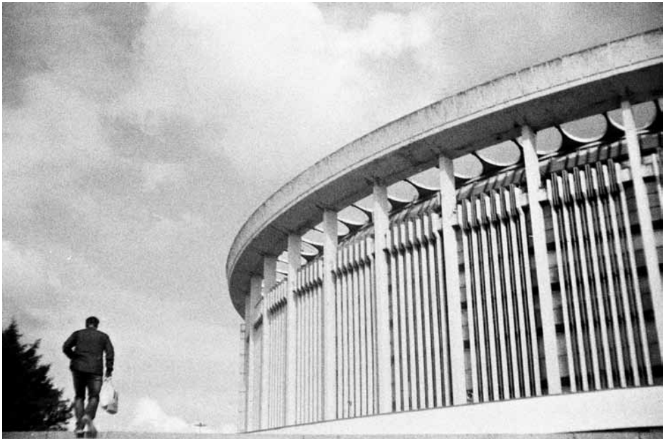
SKK Peterburgski -urheilukeskus Pietarissa. Kamera: Tšaika II.

Suomessa vallitsi ja vallitsee edelleen yleisesti mielikuva, että Neuvostoliitossa valmistetut tuotteet olivat heikkolaatuisia. Suuri osa olikin, ja sen huomasivat myös neuvostokansalaiset itse alkaessaan haalia ulkomaisia tavaroita. Nikita Hruštšov rehenteli Richard Nixonille 1950-luvun lopulla, että Neuvostoliitto saavuttaisi ja ohittaisi lännen tuotannossa ja tekniikassa. Ainakin yhden laitteen kohdalla näin saattoi käydäkin. Neuvostovalmisteiset kamerat olivat laadukkaita.