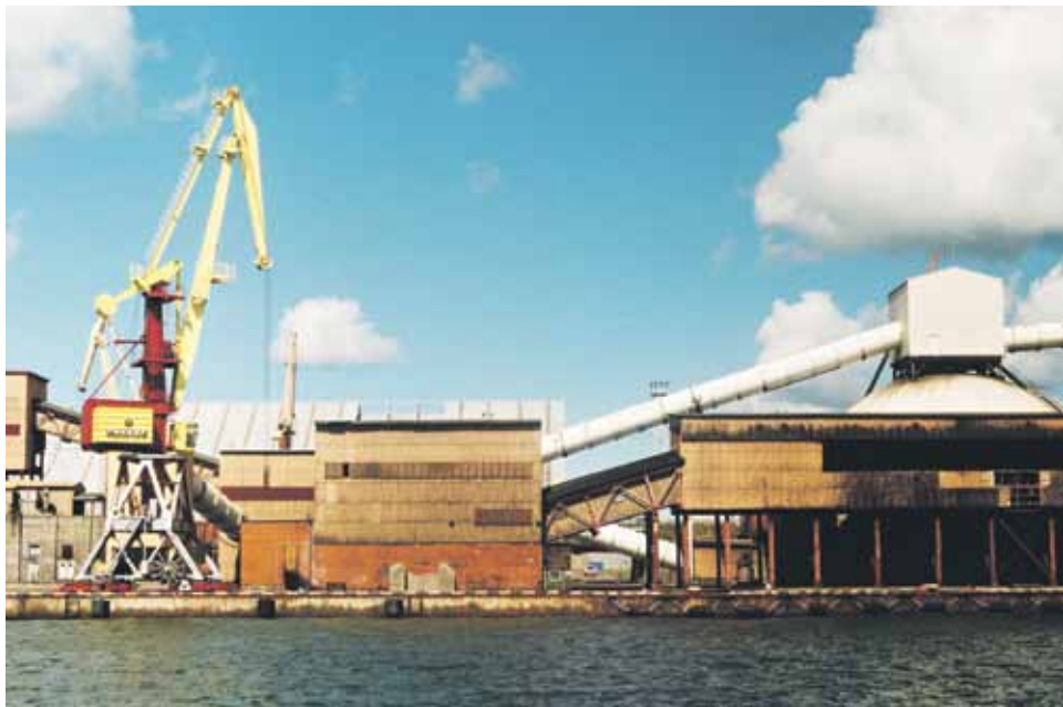
Neuvostoaikainen telakka Latvian Ventspilsin kaupungissa. Kamera: Zorki-6.

Miksi sitten nimenomaan neuvostoaikaiset kamerat? Omalla kohdallani asiaan vaikuttaa kiinnostus Venäjän ja Neuvostoliiton historiaan. En hae kameroilla nostalgiaa, vaan koen