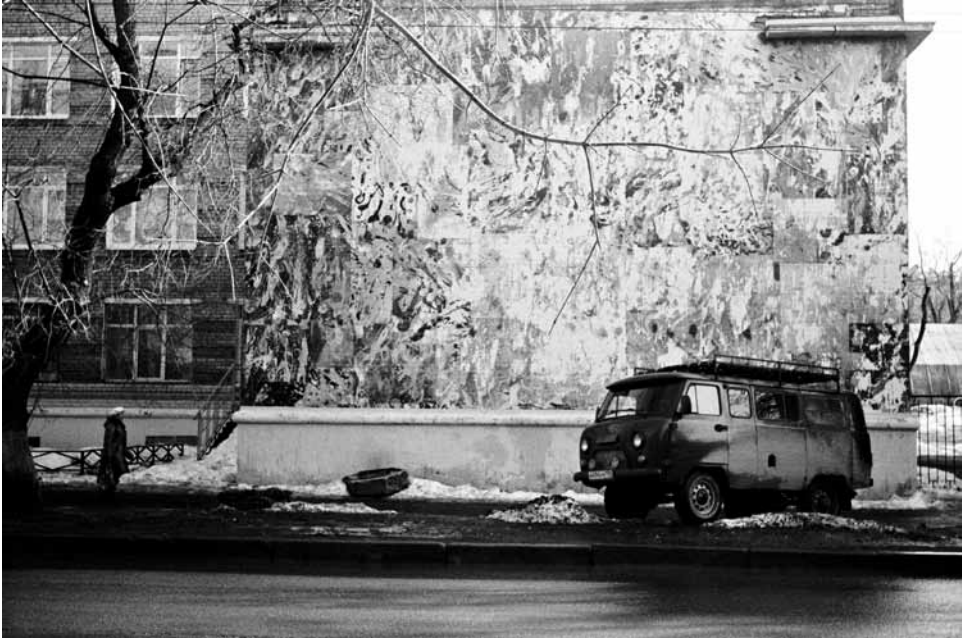
Katunäkymä Permistä. Kamera: Smena 8M.