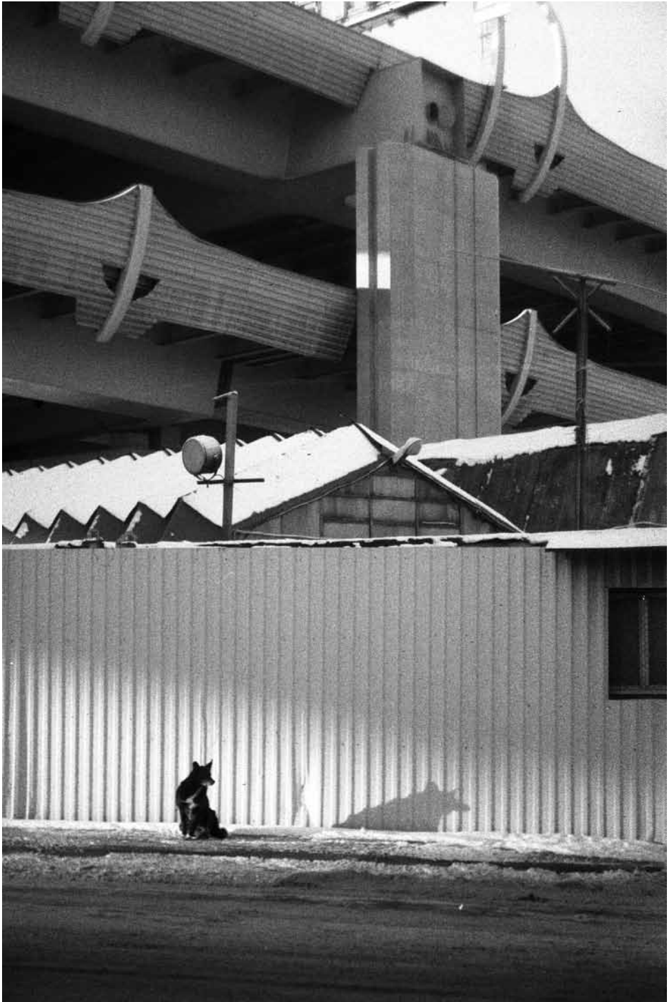
Koira varastoalueella Pietarin ohitustie ZSD:n alla. Kamera: Zorki-6.