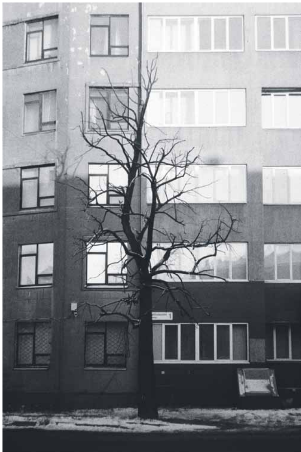
Puu esikaupunkitalon edessä Moskovassa. Kamera: Smena 8M