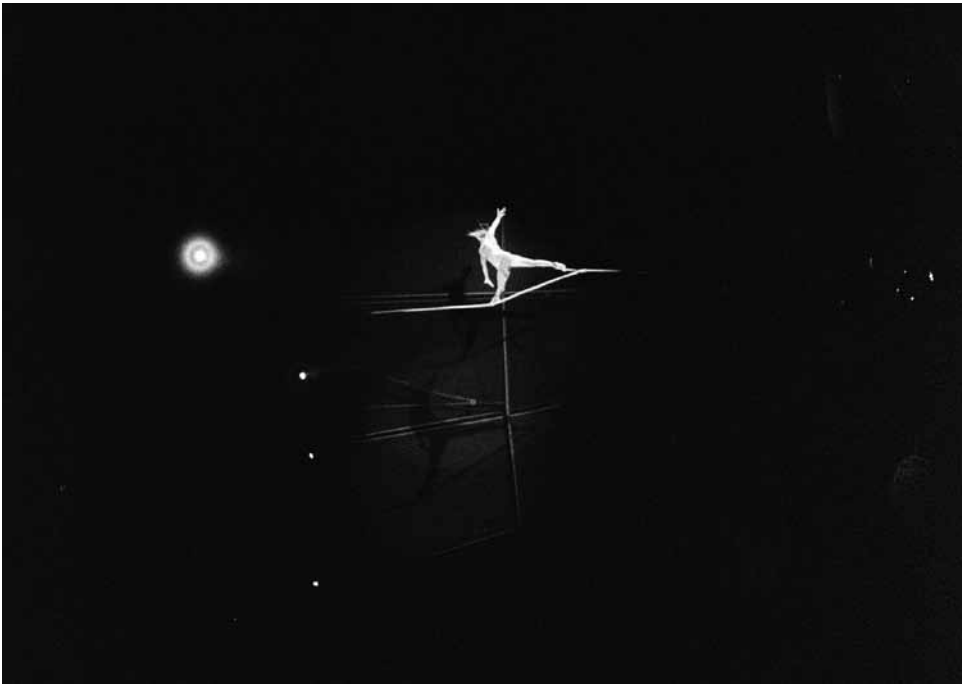
Nuorallatanssija Pietarin sirkuksessa. Kamera: Zorki-6.