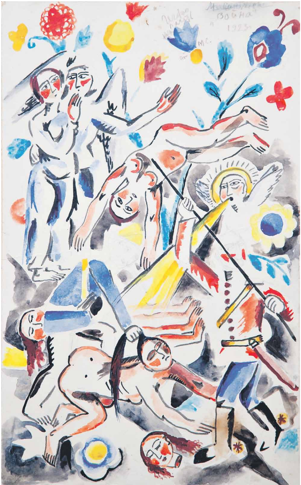
Marija Synjakova (1890–1984). Sota. 1915 (?). Mystetsjky arsenal.