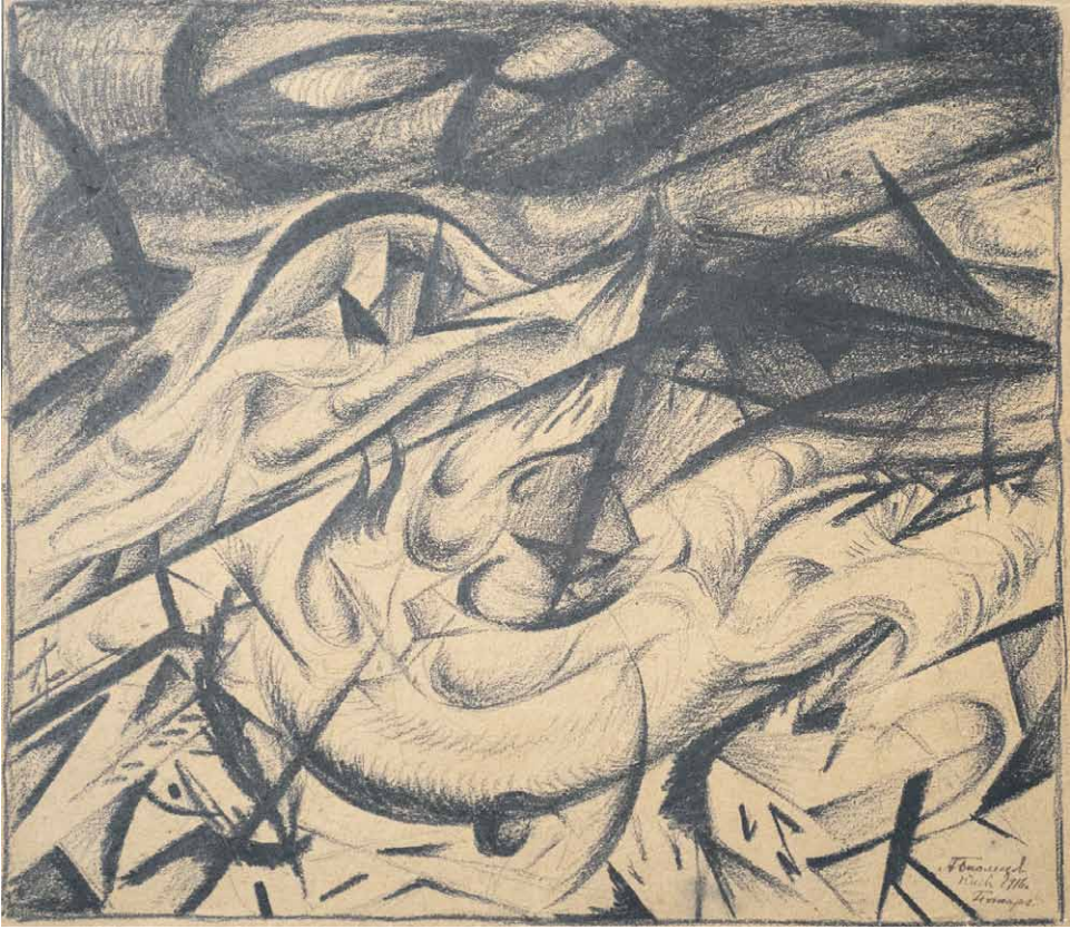
Oleksandr Bohomazov (1880–1930) Palo. 1916. Ukrainan kansallinen taidemuseo.