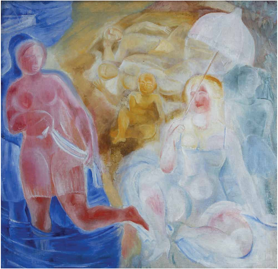
Viktor Palmov (1888–1929) Ranta. 1926. Mystetsjky arsenal.