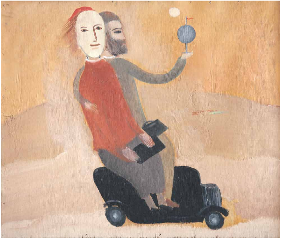
Solomon Nikritin (1898–1965) Matka maailman ympäri. 1918–1920. Mystetsjky arsenal.