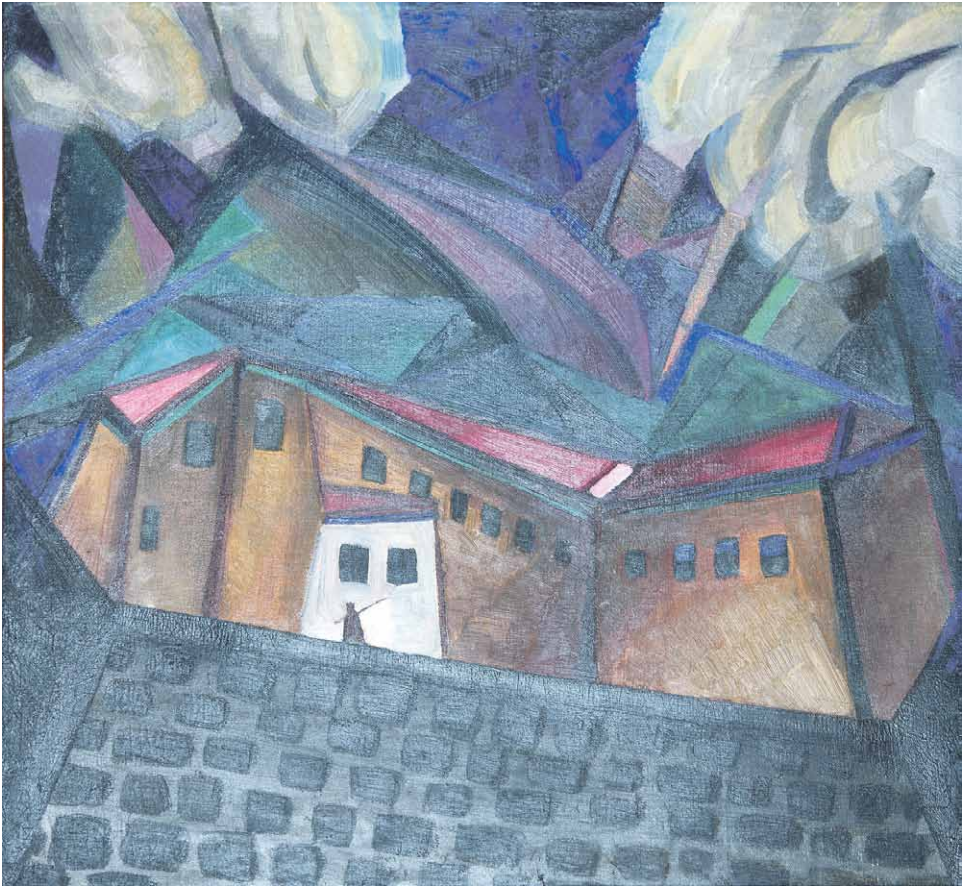
Oleksandr Bohomazov (1880–1930) Vankila Kaukasuksella. 1916. Mystetsjky arsenal.