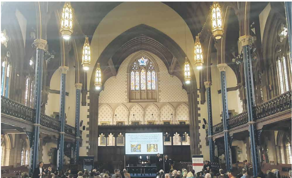
Kuva 2. Päärakennuksen Bute Hall toimi pääpuhujien esiintymispaikkana.

Pyöreän pöydän osallistajat esittelivät keskustelussa esimerkitapauksia edustamiltaan alueilta. Esimerkiksi Baltian maissa on otettu käyttöön kielipoliittisia toimenpiteitä, joiden tarkoituksena on vähentää venäjän kielen valtiollista merkitystä ja vahvistaa paikallisen kansalliskielen asemaa. Sellaisissa maissa, joihin sodalla ei ole ollut välitöntä vaikutusta, reaktiot venäjän kieltä kohtaan ovat olleet maltillisempia. Loppukeskustelussa nousi esiin myös yleisluontoisempia kysymyksiä: Kuinka paljon julkisuudessa esillä olevat tavat puhua Venäjstä eroavat toisistaan visuaalisten ja muiden