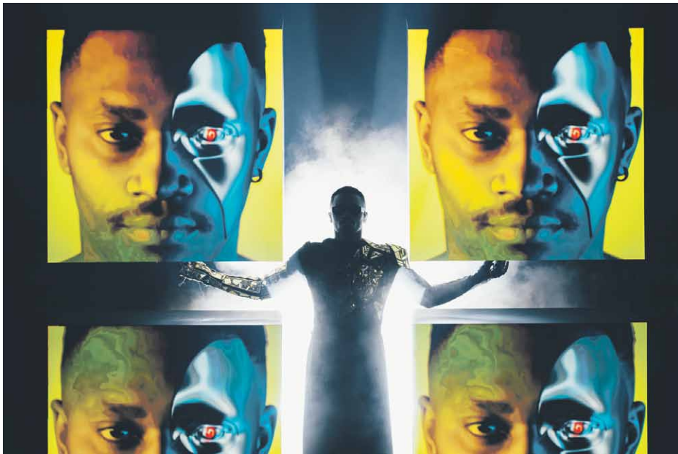
Kuva 2. Ukrainan TVORCHI-yhtyeen esityksessä mies ja kone sulautuivat yhteen.