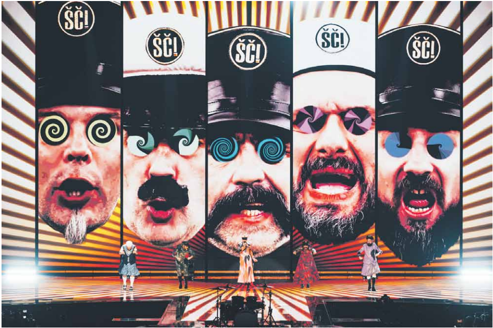
Kuva 4. Kroatian Mama Šć -esityksen räikeä suorapuheisuus pisti monien pään pyörälle.

tuva folk-yhtye Vesna ("Kevät") herätti huomiota jo vahvasti visuaalisuuteen panostavalla esikatseluvideollaan. Siinä naiset on puettu hieman groteskeiksi slaavilaisiksi figuriineiksi, joita violetit pukumiehet häiriköivät ja piinaavat erilaisin metodein. Lavaesitykseen viisikko oli puolestaan pukeutunut yhdenmukaisesti hennon vaaleanpunaisiin housuasuihin ja yli-inhimillisen pitkiin letteihin.