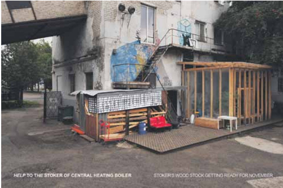
Polttopuut valmiina lämmittämöä varten.