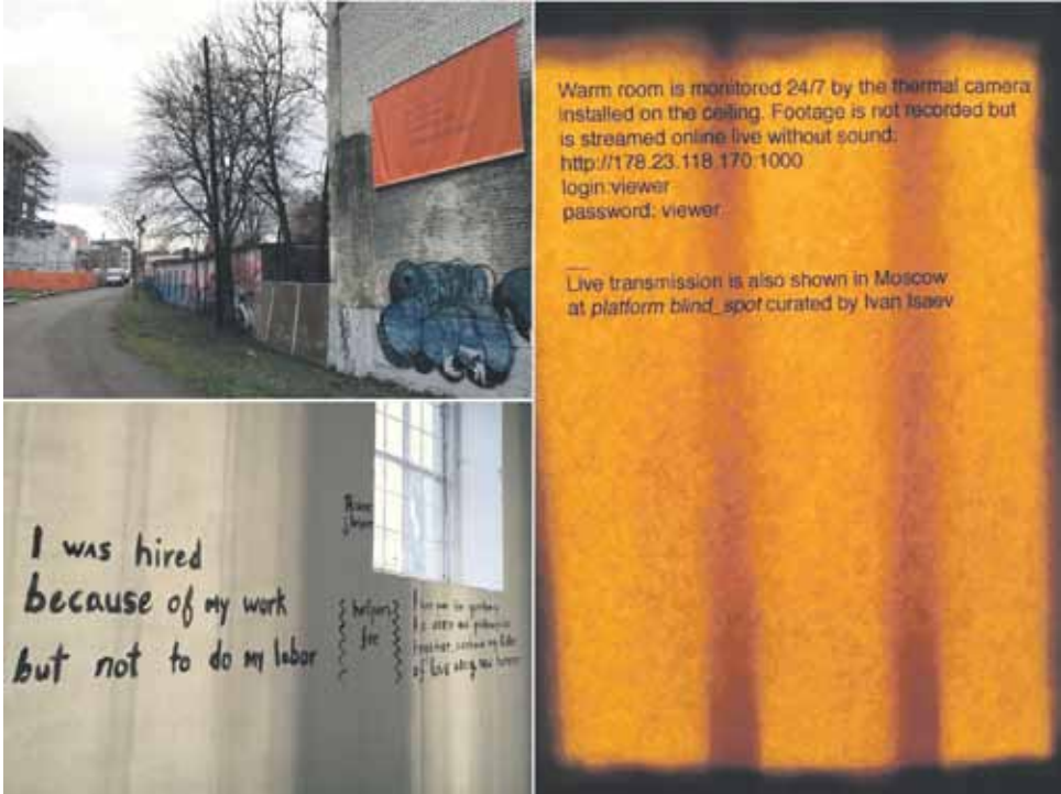
Kollaasi. Alla Tulina.