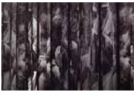
Andrey Bogush Proposal for cloud (Другу, который не спас мне жизнь), 2017 (UV print on aluminum)