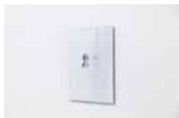
Bogdan Ablozhnyy Untitled, 2017 (print on paper)