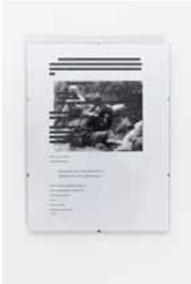
Bogdan Ablozhnyy Back from Moscow, in the USSR, 2017 (print on paper)