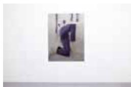
Andrey Bogush Proposal for posture, 2016 (UV print on aluminum)