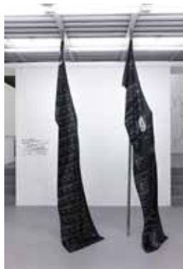
Bogdan Ablozhnyy Flag 77 You may want to practice doing things with your left hand, 2017 (left) (print on silk, metal bar)