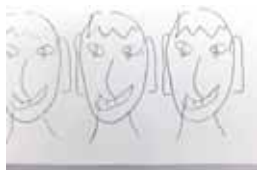
Andrey Bogush Decades (three faces, two hands), 2017 (wall drawing)