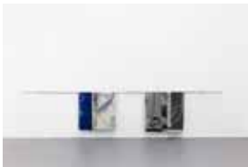
Andrey Bogush blue carpet (folded), 2017 (digital weaving, wool, metal bar) grey carpet (folded), 2017 (digital weaving, wool, metal bar)