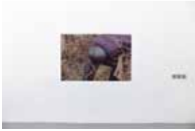
Andrey Bogush 20141122_0979 (UV print on aluminum)