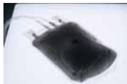
Bogdan Ablozhnyy Destroy (any state), 2017 (TNT, crystal meth, Atripia antibiotics, mercury, CFDA-1 solution)