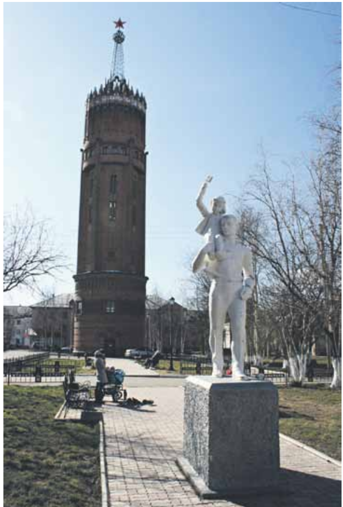
Kuva 1. Intan vankityövoimalla rakennettu vesitorni. Ville-Juhani Sutinen

Intan vesitornia kutsuttiin sen rakennusajana Baabelin torniksi, koska sen rakentamiseen osallistui niin monen eri kansallisuuden edustajia – vankeja kaikki tyynni, mukana