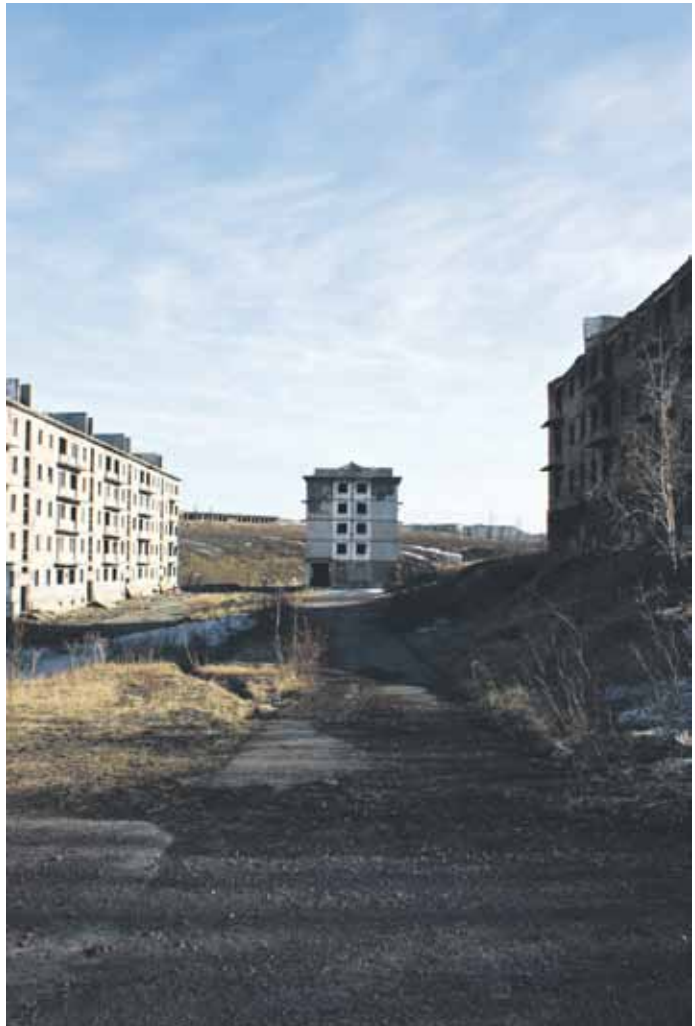
Kuva 5. Rudnikin tyhjentyneen lähion katukuvaa. Ville-Juhani Sutinen.

Irina pysäyttää auton Vorkutajoen länsirannalle. Maasta pistää mädäntyneitä pölkkyjä: vanhojen parakkien perustuksia ja radan jäänteitä. Uudempi junarata kaartaa niiden takana, mutta sekään ei taida olla käytössä, sillä nousemme kiskoille ja kävelemme niitä pitkin kohti hitaasti rapistuvaa muistoa. Tällä alueella sijaitsi Vorkutan ensimmäinen kaivos Kapitalnaja,