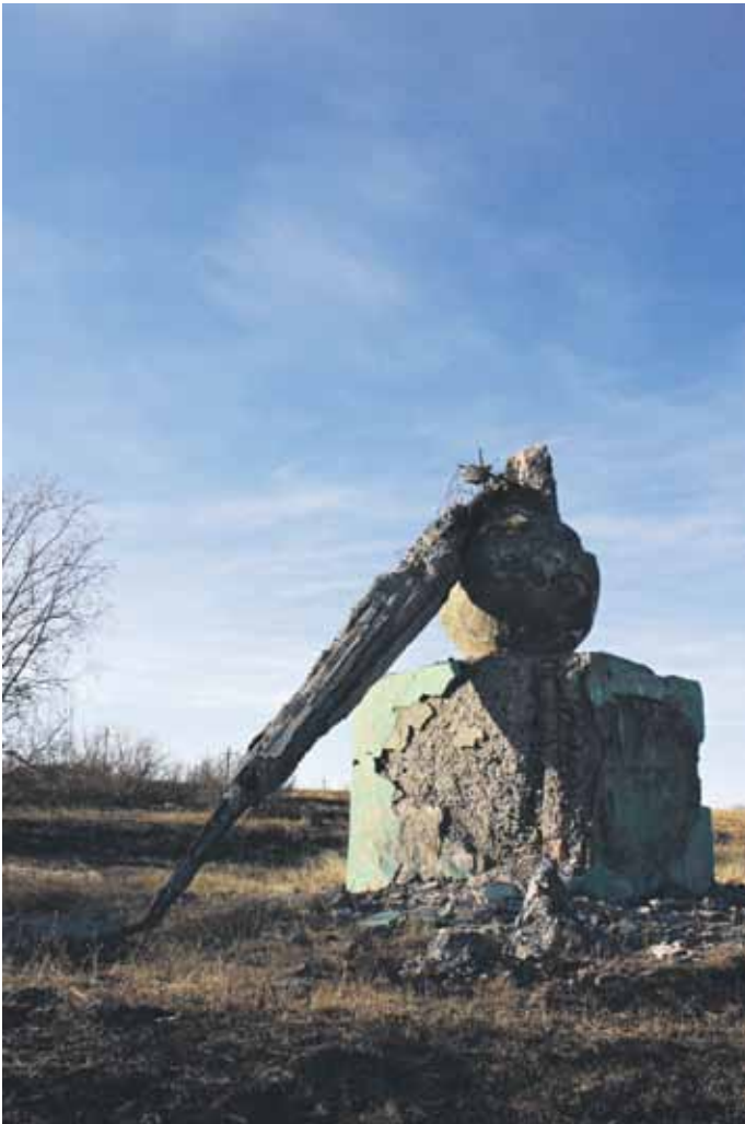
Kuva 4. Neuvostoaikainen muistomerkki Vorkutan ensimmäiselle kaivokselle. Ville-Juhani Sutinen.

Gulag vaikuttaa Vorkutan nykypäivään myös vähemmän ilmeisillä, mutta hyvin konkreettisilla tavoilla. Kaupunkia kiertää kehätie. Se kulki aikoinaan kaivoskuilulta toiselle. Kaivosleirejä alun perin yhdistänyt rata retkottaa niin ikään poikki karun kamaran, mutta ei ole enää käytössä. Vorkuta rakentuu edelleen saman kaavan mukaan kuin silloin, kun lähes koko kaupunki