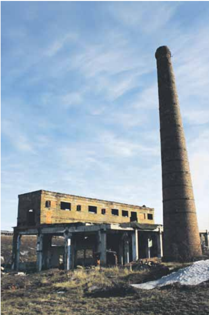
Kuva 2. Hylätty hiilenkäsittelylaitos Vorkutassa. Ville-Juhani Sutinen.

Intan keskustassa vesitornin kaltaiset reliikit ovat säilyneet ja ovat edelleen käytössä, mutta kaupungin reunalla muistot ovat muuttuneet raunioiksi. Vostotšnin kylä vajaan kymmenen kilometrin päässä Intasta on hylätty. Siellä asui moni leiriltä vapautunut. Viereiset tehtaat ovat