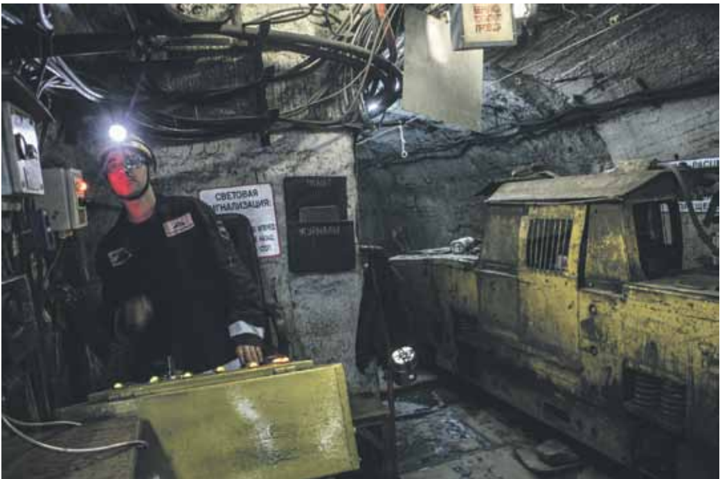
Norilskin laitamilla sijaitsevat kaivokset. Yhdessä niistä, 1300 metrin syvyydessä, Talnahin lähiössä, onnistuivat jopa käymään. Talnahin maanalaisten malmikaivosten pituus on yhteensä noin 3000 kilometriä. Vertailun vuoksi sanottakoon, että Moskovan maanalainen junaverkosto on vain 300 kilometriä pitkä.