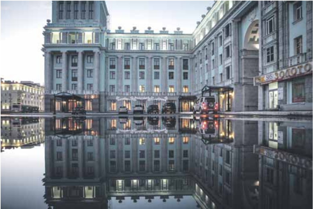
Norilskin pääkatu – Leninski prospekt – on kuin Pietarin Nevski prospektin kopio pienoiskoossa. Sitä reunustavien rakennusten kaivopihat suojaavat asukkaita lumimyrskyiltä. Stalinin ajan empirerakennukset seisovat kallioisilla rinteillä, uudemmat, nykyaikaiset talot on rakennettu paalutettuihin notkoihin.