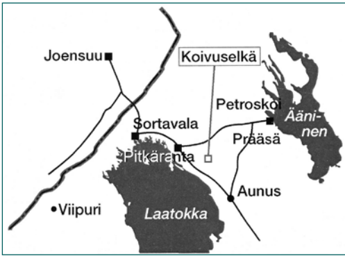
Kuva 1. Koivuselkä Karjalassa

avulla selvitimme Koivuselän muuttuvaa asemaa Karjalan metsäkompleksin osana, palvelujen ja arjen muutoksia sekä kyläläisten selviytymistä transitiossa (Oksa 1998a; Varis 1998a; Piipponen 2007). Heinäkuussa 2014 suomalais-venäläinen tutkijaryhmämme palasi Koivuselkään päivittämään ja täydentämään kylän kehitystä koskevaa aineistoa ja selvittämään, mitä on tapahtunut viimeisen 20 vuoden aikana.