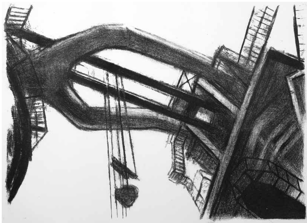
№7 Pavel Otdelnov