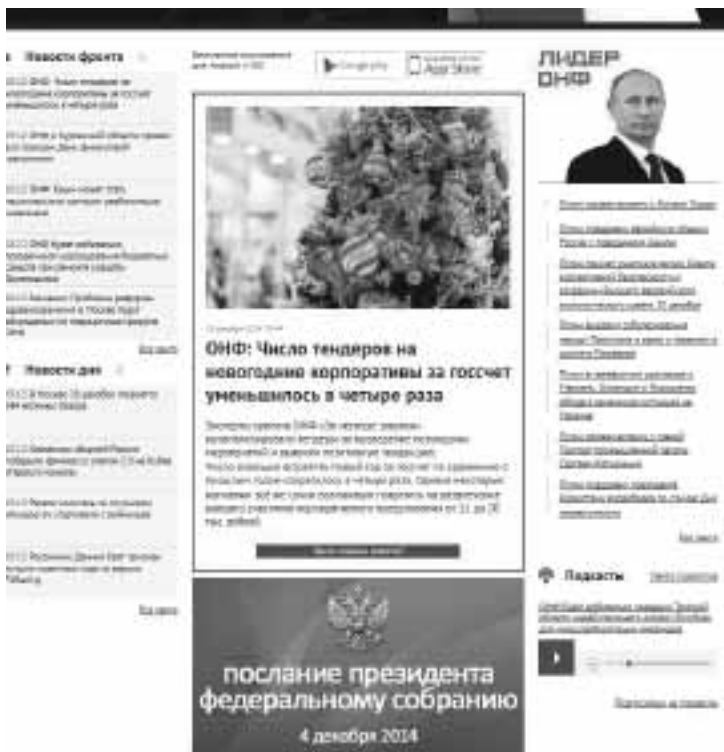
Kuva 2. Kuvakaappaus Yleisvenäläisen kansanrintaman sivulta 19.12.2014.

Syyt valtion hankintojen rehellisyyttä tarkastelevalle projektille ovat ilmeiset vuosien 2011–2012 protestien jälkeisellä Venäjällä. Viimeistään silloin Kremlin ja Putinin vuosia julistama ”taistelu korruptiota vastaan” menetti aloitteellisuutensa Kremlistä riippumattomalle antikorruptioaktivismille. Vapaasti leviävän Internetin myötä korruptiopaljastukset eivät ainoastaan olleet enää Kremlin hallitseman