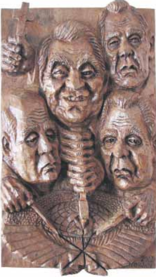
"Neuvostoliiton loppu" (2013) Yhdysvaltojen puolustusministeri Donald Rumsfeld siunaa Boris Jeltsinin, Leonid Kravtšukin ja Stanislav Šuškevitšin, kun nämä leikkaavat halki Neuvostoliiton vaakunaa. Puureliefi.