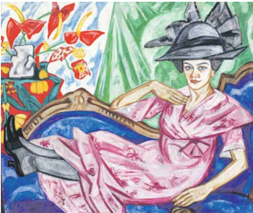
Olga Rozanova: Sisko Anna Vladimirovna Rozanova (1911)