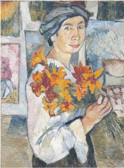
Natalia Gontšarova: Omakuva (1907)

Maria Baškirtseva oli myös innokas naisasian esitaistelija. Hän liittyi naistaiteilijoiden Union des Femmes Peintres et Sculpteurs -järjestöön ja osallistui radikaalin naisliikkeen ( Le Droit des Femmes ) kokouksiin, tosin valeasuisena ja tekaistulla nimellä Pauline Orell. Hän myös kirjoitti radikaaliin feministiseen Le Citoyenne -lehteen ja avusti sitä taloudellisesti.