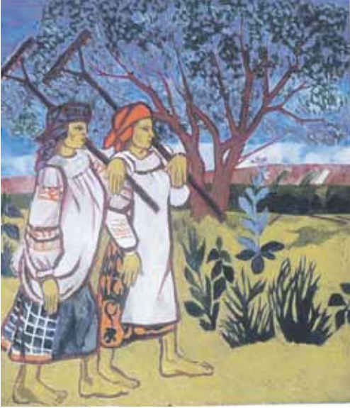
Natalia Gontšarova: Naisia haravoineen (1907)