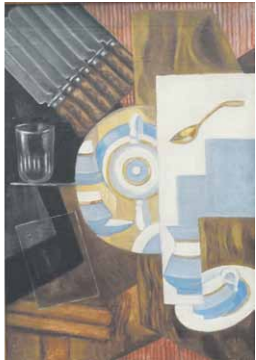
Olga Rozanova: Astioita sivupöydällä (1915)

Teksti perustuu Naisia Venäjän kulttuurihistoriassa -teoksen venäläisiä naistaiteilijoita käsittelevään lukuun.