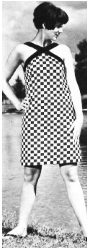
Puolalaisia vaatteita neuvostoliittolaisessa Zhurnal Mod -lehdessä (2/1967).

Neuvostoliittolaisia vaatteita arvostettiin neuvostokuluttajien parissa vähiten. Neuvostokuluttajat olivat kenties kaikkein tyytymättömiä kotimaisesta kulutustavaratuotannosta juuri