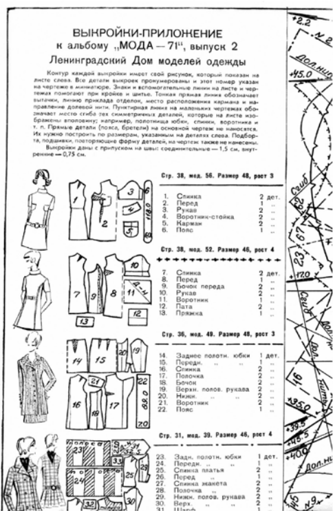
Moda Leningrad 1971 kaavasuunnitelma.

Tässä artikkelissa olen osoittanut, että toisin kuin usein esitetään, suunnitelmatalous ei ollut muut- tumaton. Puolan kansantalouden kokonaisuun- nitelma rooli muuttui 1950- ja 1960-lukujen taitteessa alatason toimintaa yksityiskohtaisesti säätelevästä mekanismista kehitystä viitoitta- vaksi suunnitelmaksi. 1960-luvun puoliväliin