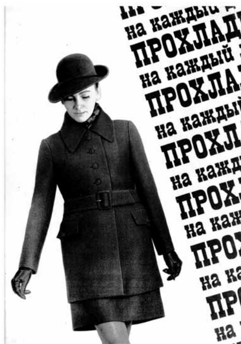
Syysmuotia lehdestä Moda Leningrad (1971).

Puolan valmisvaateviennistä 1960-luvun puolivälistä vastannut ulkomaankauppayhtiö Confexim lähetti ulkomaankauppaministeriön suunnitteluosastolle marraskuussa 1964 valmisvaatteiden viisivuotiskauden 1966–1970 vientisuunnitelmansa. Laatimassaan suunnitelmassa Confexim esitti kasvattavansa valmisvaatteiden vientiä. Kun vuoden 1965 suunnitelma oli yli 142 miljoonaa laskennallista zlotya 8 , vuoden 1970 tavoitteet kohosivat yli 215 miljoonaan zlotyyyn. Puolan viennin arvo Neuvostoliittoon vuonna 1964 oli 2,8 miljardia zlotya (Statystyka Handlu Zagranicznego 1965, 21). Vaatteiden osuus kokonaisviennistä oli siis pieni, mutta vaateteollisuudella oli aikomus kasvattaa vientilukuja pysyäkseen viennin kasvun tahdissa tai jopa kasvattaakseen osuuttaan. Confexim oli pohjustanut vientitavoitteitaan jo ennen suunnitelman lähettämistä ulkomaankauppaministeriöön. Tavoitteet oli vahvistanut korkean tason henkilö, suunnittelukomitean ulkomaankaupasta vastannut ensimmäinen varajohtaja ja entinen ulkomaankauppaministeri Tadeusz Gede, jo vuoden 1964 kesällä. (Confeximin 2.11.1964 päivätty viisivuotissuunnitelma; Jasiński 2011, 221–223.)