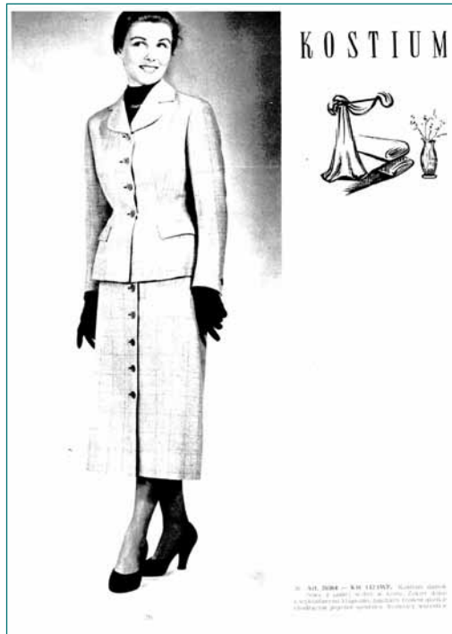
Vaateteollisuuden keskushallinnon julkaisema vuoden 1955 syksy-talvi vaatemallistokatalogi (Odzież. Jesień-zima 1955. Katalog przemysłu odzieżowego).

Eri tasojen suunnitelmat pyrittiin harmonisoimaan keskenään, ja yksityiskohtaisempien suunnitelmien tuli sisältyä yleisluonteisimpiin suunnitelmiin. Ylhäältä annettujen suunnitelmien yleisluonteisuudesta johtuen jouduttiin suunnitelman toteutuksen yksityiskohtiin ottamaan kantaa alatasoilla. Esimerkiksi ulkomaankauppa-ministeriö saattoi antaa ulkomaankauppayhtiölle vuosittaisen myyntitavoitteen Neuvostoliittoon, mutta ulkomaankauppayhtiön tuli määrittellä, mitä malleja ja mitä kokoja se yritti myydä – yrittikö se myydä enemmän miesten talvitakkeja vai lasten aluspaitoja – saavuttaakseen vuoden myyntitavoitteeksi asetetun summan. Käytännössä kuitenkin ministeriöt ohjeistivat 1950-luvun puoliväliin asti niin yksityiskohtaisesti myös suunnitelmien toteutusta, että alatasolle ei jäänyt suurta tulkinnanvaraa.