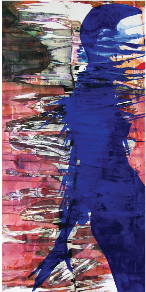
Model in Klein Blue, 2010

Christesevan valkovenäläinen tausta vaikuttaa voimakkaasti hänen viimeisimpään projektiinsa, joka on muistomerkki 70 vuotta