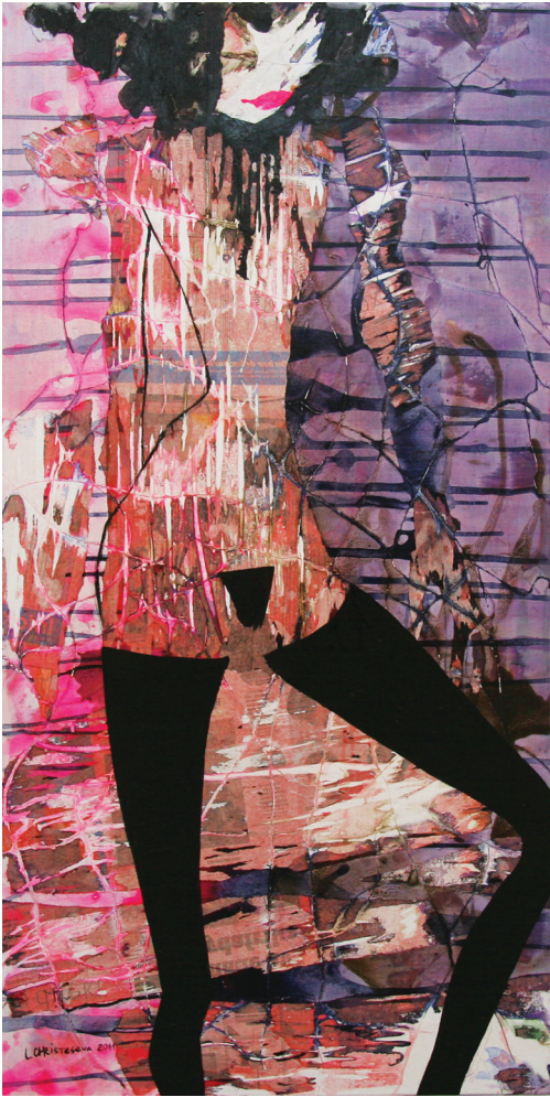
She Le Egon, 2011

kaasti Christesevan tematiikkaan, samalla kuin postmodernismi ja etenkin informalismi ovat leimanneet itse teoksen tekemisen vaikutusta kokonaisuuden kannalta.