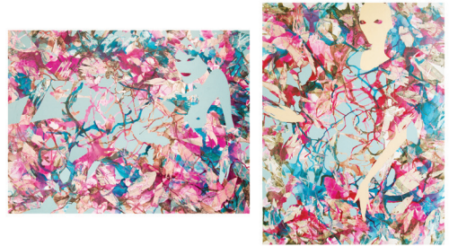
Before and After

vas Minskin yllä on saavuttamaton. Siellä puut kahlitsevat asukkaita ja rajoittavat heidän mahdollisuuksiaan vapauteen ja onneen. Se, miten tulkitsemme taivaan yläpuolellamme, juontuu omasta ympäristöstämme ja kokemuksistamme.