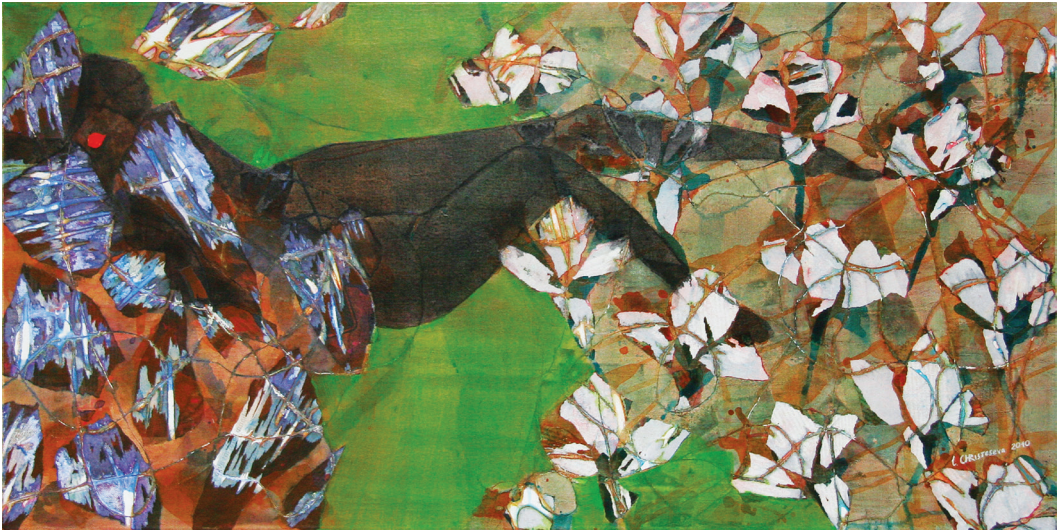
La Negresse, 2010