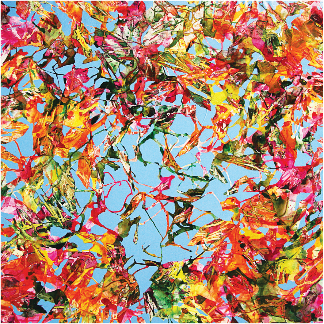
Sky over Minsk, 2010