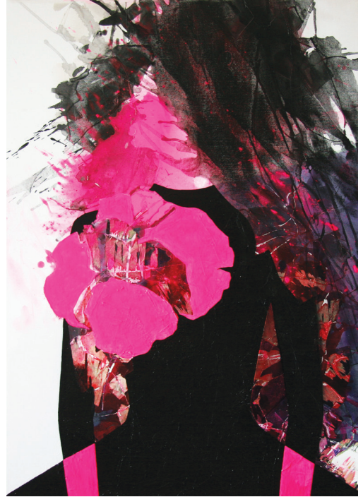
Dress Code, 2010

Taivas Minskin yllä on käsitteellisesti erilainen kuin Taivas Tukholman yllä ; Christesevalle Taivas Tukholman yllä on rauhallinen ja suojattu värikkäillä lehdistä ja oksilla – vastaavasti Tai-