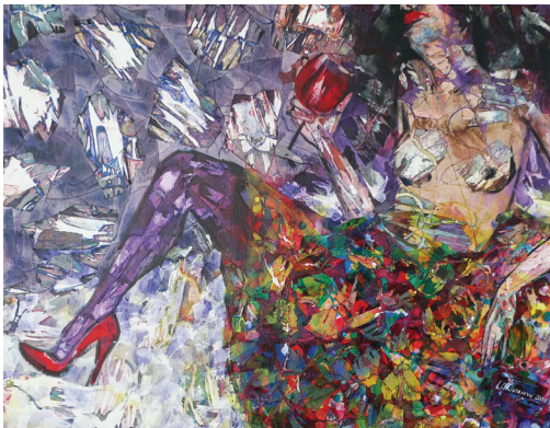
Woman Relaxing with a Glass of Wine, 2009