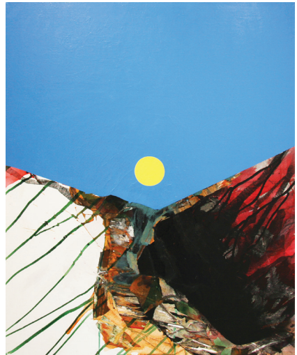
With or without You, 2011