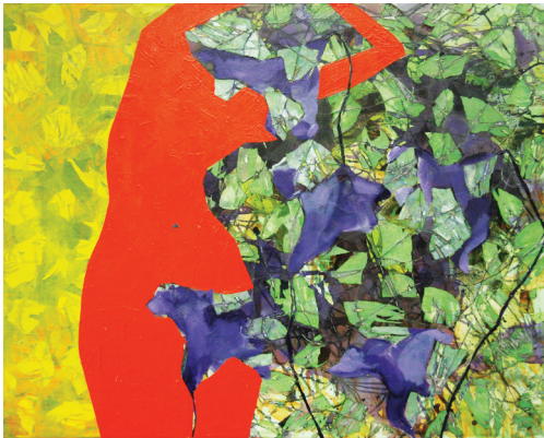
Matisse's Inspired Nude, 2010