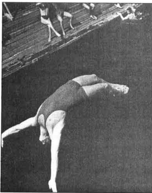
Aleksandr Rodišenko: Hyppy veteen (1936)

Televisiourheilu toimii myös hyvässä yhteistyössä mainonnan ja mainosohjelmien kanssa. Urheilulähetyksen rahoitus on tavallistakin riippuvaisempi mainostuloista ja sponsoreista, mistä syystä mainokset kattavat valtavan tilan – koko stadionin, pelikentän, urheilijan vaatteet – ja lähetyksen rikkoo usein mainoskatko. Myös muissa kuin vain urheilumainoksissa käytetään huippu-urheilijoita tähtinäyttelijöinä: aivan ilmeisesti heidän asemansa, ammattitaitonsa ja esimerkkiroolinsa yhteiskunnassa luo mainosmaailmassa harvinaista uskottavuutta ja on siten tuottoisaa mainostajalle. Huippu-urheilijat ovat mainoksissa paljon uskottavampia roolihahmoja kuin kuuluisa Marlboro-cowboy, vaikka he