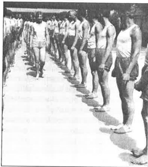
Aleksandr Rodtšenko: Tietä naisille (1935)