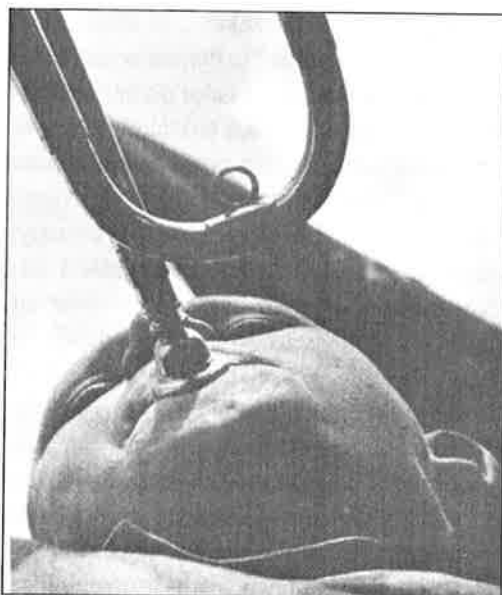
Aleksandr Rodtšenko: Pioneeritruumetisti (1930)

Televisiolla on urheilutapahtumien välittämisessä erityisasema. Televisiokamera pystyy aina tallentamaan tarkemmin, kertomaan tapahtumista värikkäämmiin ja antamaan katsojalle enemmän kuin muu media. Elokuva-, televisio- tai videokamera myös luo uusia mahdollisuuksia kuvata urheilukilpailuja: urheilijan suoritusta voidaan hidastaa, eri kuvakulmista voidaan kuvata muuten huomaamattomia pieniä yksityiskohtia. Kamera voi liikkua vapaasti myös muuten; urheilijoita voidaan kuvata alhaalta, ylhäältä, edestä ja takaa. Kamera voi seurata juoksijaryhmää rinnalla, se voi kuvata pelikenttää esimerkiksi lintuperspektiivistä ja hidastetut tai toistetut kuvat kertovat tarkasti jonkun kilpailun ratkaisuhetken. Televisiokamera voi myös tahtomattaankin luoda katsojan eteen tilanteen, jossa tämä joutuu punnitsemaan näkemäänsä uudelta kantilta. Esimerkkinä voisi olla vaikka mäkihyppy, josta televisionkatsoja, kameran