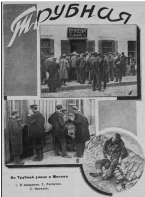
"Takapajuisia" ajanviettotapoja Trubnaja-kadulla Moskovassa vuonna 1929: "1. Odotellaan 2. Ryy-pätään 3. Humalassa". ( Trezvost i kultura , 1929 11, 6.)

kovaa työläiselämää tavanomaisella ja halvalla tavalla" (Kabo 1928, 193). Suurista toiveista huolimatta neuvostovalta ei ollut lopettanut juomista. Ideaalin työläisen hahmo oli vielä tulevaisuutta.