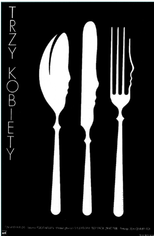
Mieczysław Wasilewski, Trzy kobiety (Kolme naista) , amerikkalainen elokuva, 1978