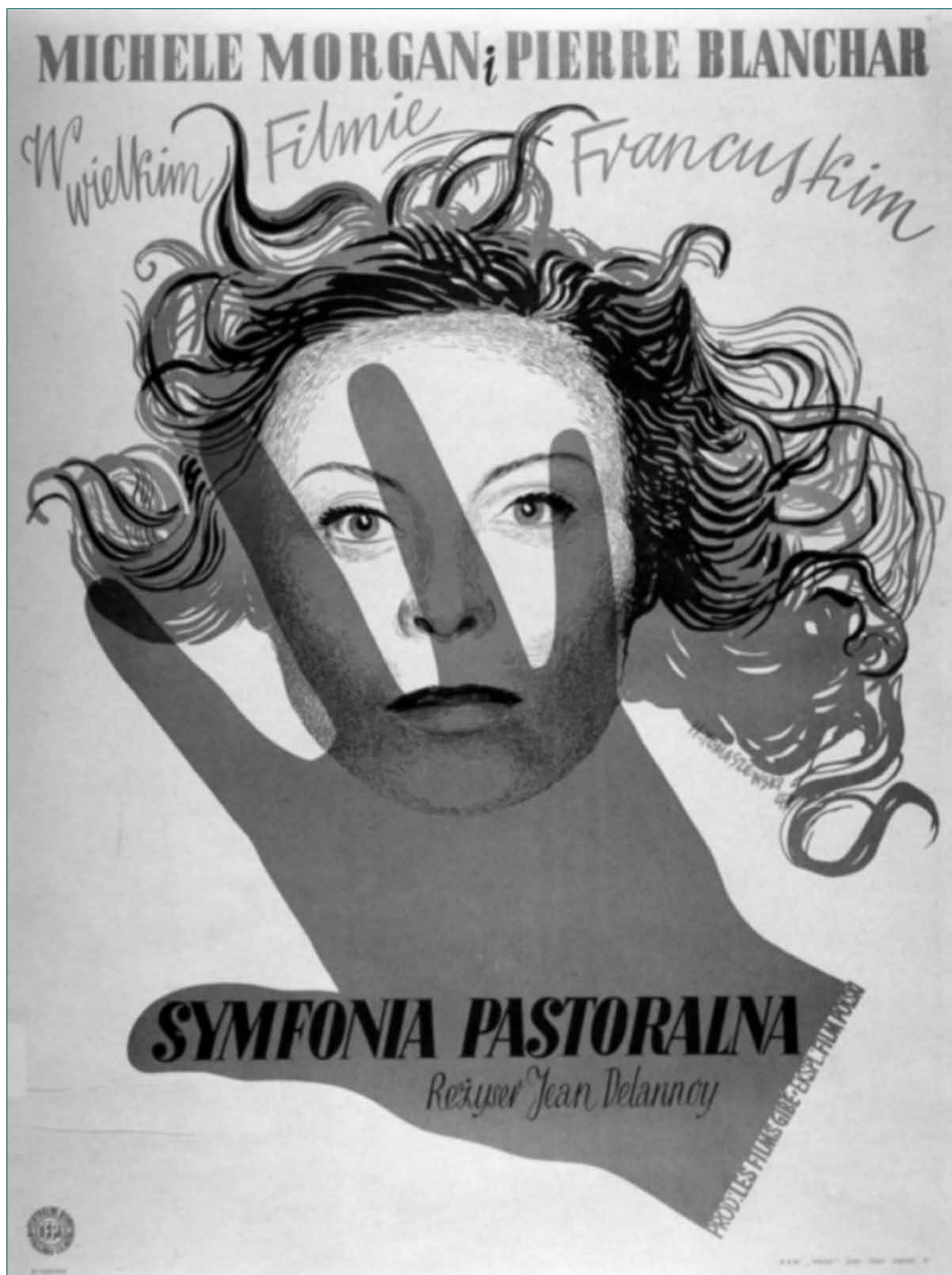
Henryk Tomaszewski, Symfonia pastoralna (Pastoraalisinfonia) , ranskalainen elokuva, 1947