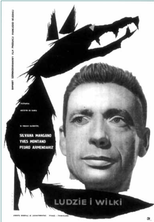
Roman Ciesiewicz, Ludzie i wilki (Ihmisiä ja susia) , italialais-ranskalainen elokuva, 1959