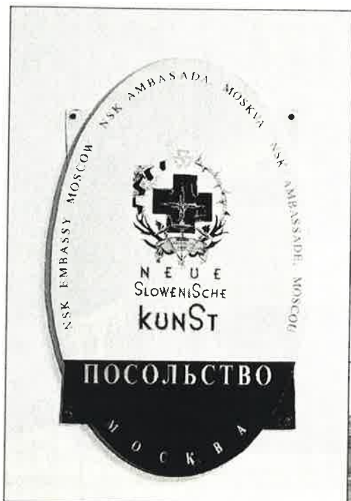
Moskovan lähetystön kyltti.