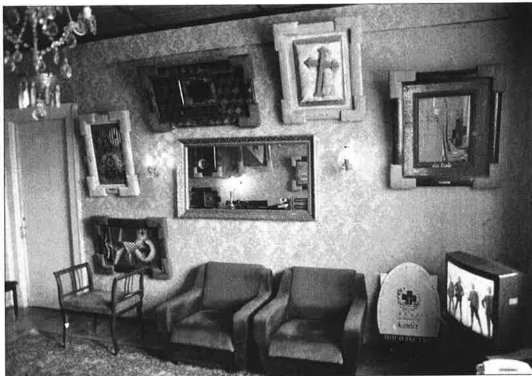
NSK avasi suurlähetystönsä moskovalaisessa asunnossa Leninski Prospektilla 1992.

musiikkiryhmä Laibach, teatteriryhmä Scipion Nasice Sisters Theater, graafisen suunnittelun ryhmä New Collectivism ja teoreettinen Department of Pure and Applied Philosophy. Kollektiivi alkoi totalitarismin kritiikkinä sosialistisessa Jugoslaviassa.