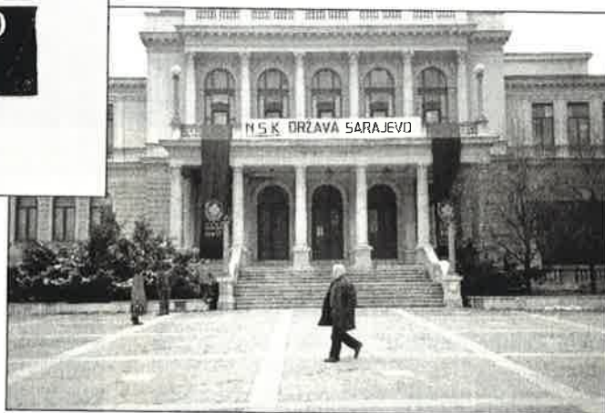
Sarajevon kansallisteatterista tuli osa NSK-valtiota marraskuussa 1995.