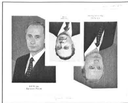
Kimmo Sarje: Venäläinen maisema, 2004, montaasi, 36 x 46,5 cm.