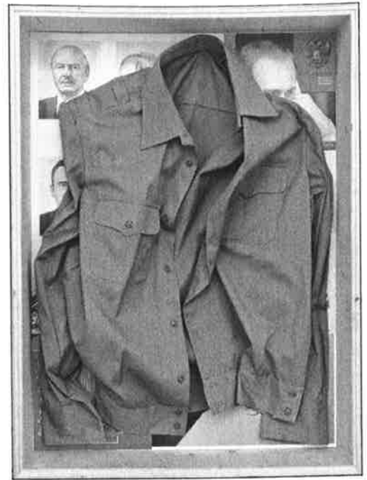
Kimmo Sarje: Venäläinen maisema (Vihreä paita) , 2006, kollaasilaatikko, 74 x 55 x 12,5 cm.

Putin on presidentti! Kaiken lisäksi aktiivinen ja työkykyinen presidentti, jolla ei ole maan kannalta